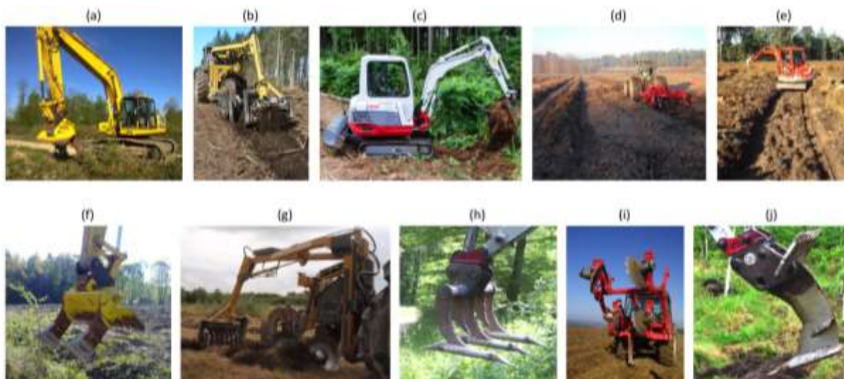
Figure 3 : Vues des outils de PMS : bident Maillard (a) et (f), charrue bidisque motorisée (b) et (g), Scarificateur réversible (c) et (h), Culti-3B (d) et (i), Sous-soleur multifonction (e) et (j)