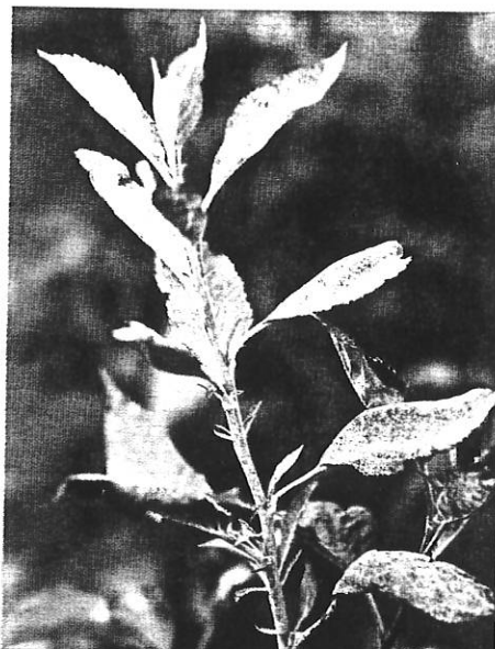
Symptômes d'Oïdium sur pousse. Facile à identifier dans les vergers, ce parasite obligatoire est difficile à conserver au laboratoire pour l'étudier correctement. Un important travail de mise au point de méthodes d'isolement, conservation et inoculation est en cours.

En ce qui concerne l'Oïdium, l'existence de races n'est pas formellement démontrée. Il s'agit dans le cadre du projet de constituer une collection européenne de souches de P. leucotricha , et de les confronter à une gamme de pommiers pour mettre en évidence d'éventuelles interac-