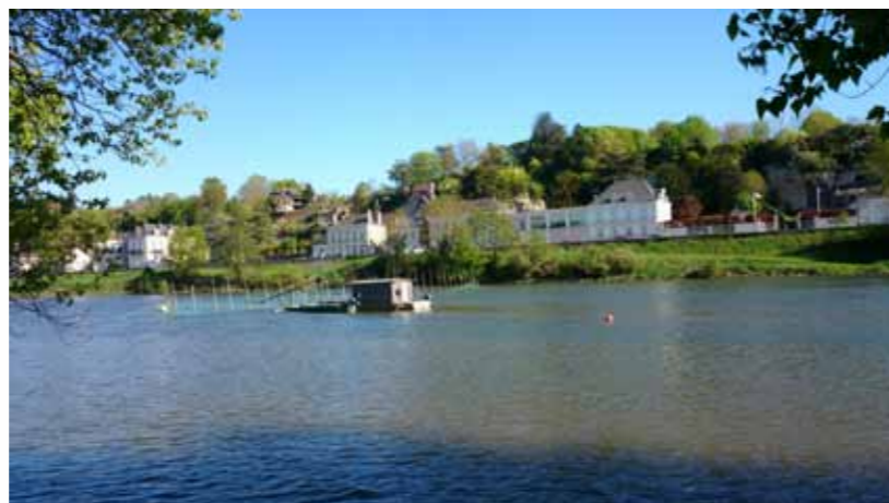
fig. 1 : Filet-barrage sur la Loire à Amboise

appelés filets emmêlant pour les adultes, et à l'aide d'une senne de plage (filet non maillant) pour les alosons.