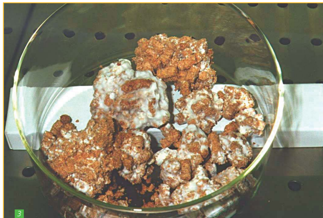
Figure 3 : Trametes versicolor colonisant des granulés lignocellulosiques pour inoculation de sol

Dans cette seconde approche, les souches fongiques pourraient être criblées sans a priori afin de mettre en évidence des protéines/systèmes enzymatiques spécifiquement sécrétés/induits durant le développement fongique en présence de chlordécone. Ces souches peuvent être soit isolées de sols pollués, soit sélectionnées dans les