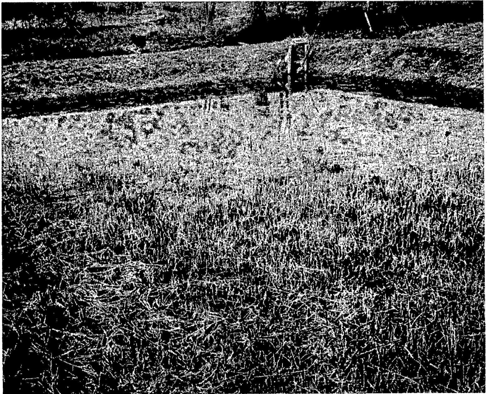
Figure 1 : Petit étang à fond enherbé utilisé pour la production de brochetons par reproduction naturelle aménagée.

La majeure partie de la superficie des étangs doit être bien pourvue en végétation. En ce qui concerne nos sites expérimentaux, la végétation se composait de graminées aquatiques ( Phalaris sp., Glyceria sp.), d'oseille aquatique ( Rumex sp.) et d'herbes terrestres submergées au Paraclet (Fig. 1), et d'Élodée ( Helodea canadensis ) dans la Dombes. En fait, le brochet fait preuve d'un certain opportunisme dans le choix du substrat de ponte (voir McCARRAHER et THOMAS, 1972 et revue par SOUCHON, 1983), et des formations végétales très variées peuvent convenir à sa reproduction naturelle : graminées ( Agrostis sp., Calamagrostis sp., Glyceria sp., etc.), jonc ( Juncus bulbosus ), cypéracées ( Carex sp., Scirpus sp.), potamots ( Potamogeton sp.), utriculaires ( Utricularia sp.), myriophyllées et cératophyllées, plantes nageantes à tiges submergées comme le plantain d'eau ( Alisma sp.), ou encore tapis denses de végétation courte ( Chara sp.), herbes terrestres de prairie ou de fossé inondés et débris végétaux divers. Pour la détermination de végétaux aquatiques, on pourra se référer à l'article de BARBE (1984).