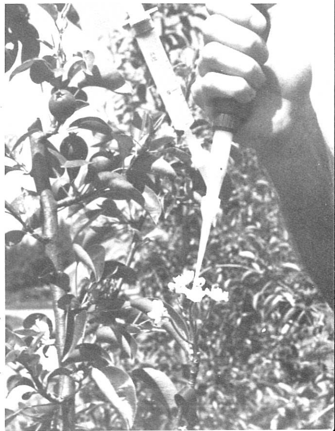
Inoculation sur fleurs au Repetman.

cultivés plusieurs années en conditions naturelles de contamination. Une échelle de sensibilité était établie de 0 à 10 (Van der Zwet et al. , 1970) prenant en compte l'étendue des parties atteintes de l'arbre. L'avantage de cette méthode est qu'elle ne fait pas intervenir artificiellement l'homme; par contre, elle peut demander un laps de temps assez long avant de permettre une classification fiable; de plus, elle ne permet pas de localiser l'origine de l'infection: fleurs ou rameaux. Or il a été montré (Van der Zwet, 1975) que la sensibilité de ces organes pouvait présenter des différences importantes.