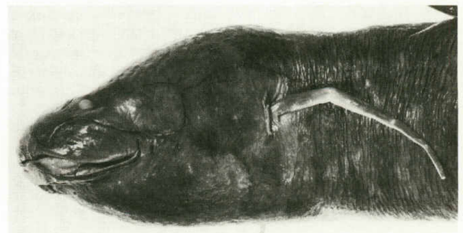
Fig. 2. - Tête de Lepidosiren paradoxa (MHNG 1223-22) vue de profil.