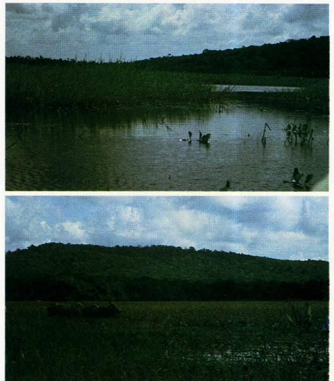
Fig. 4. - En haut : Rivière de Kaw, 10 km en amont du village de Kaw. En bas : Savane inondée. Vue générale.