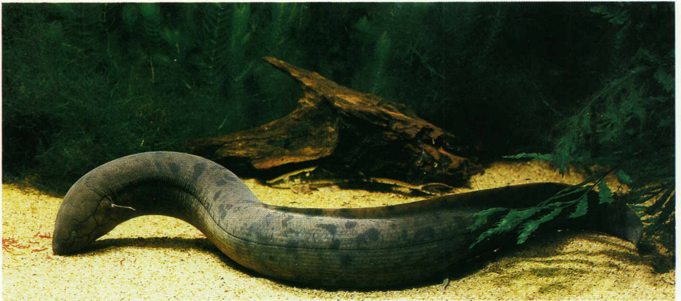
Fig. 1. - Lepidosiren paradoxa , spécimen de Kaw, élevé à Nancy depuis le 7 octobre 1984 (bac 20). Don du Laboratoire d'Hydrobiologie de l'INRA, Kourou. D. Terver.

par P.Y. LE BAIL*, P. PLANQUETTE** et J. PETIT*