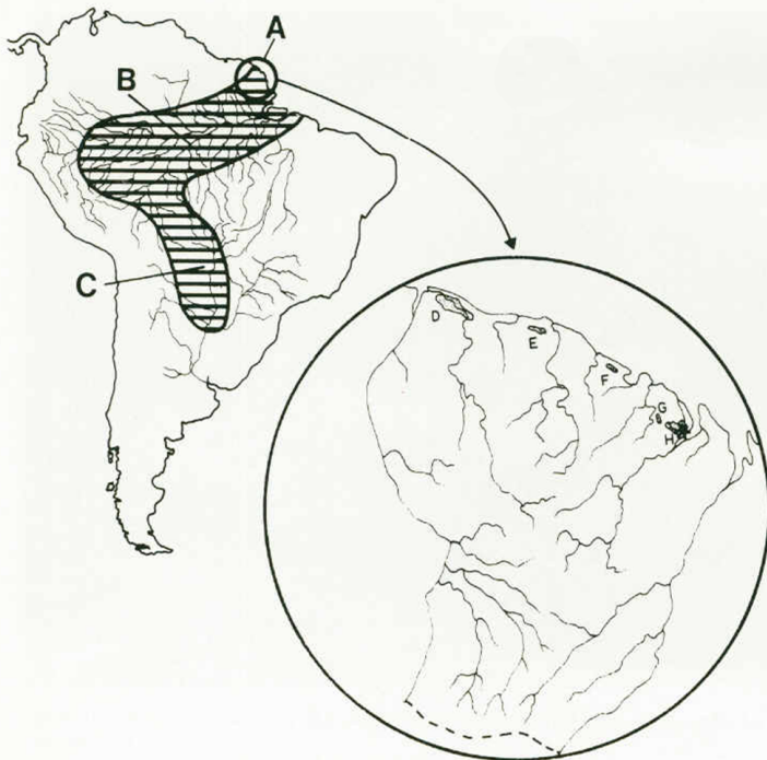
Fig. 3. - Répartition géographique de Lepidosiren paradoxa A, Guyane ; B, Bassin Amazonien ; C, Grand Chaco ; D, Marais de Mana ; E, Trou Poisson ; F, savane de Macouria ; G, Savane Gabrielle ; H, Marais de Kaw. En pointillé = zone marécageuse, astérisque = localisation en Guyane de Lepidosiren paradoxa .

Depuis, dans le cadre de l'inventaire de l'ichtyofaune guyanaise entrepris par l'INRA, trois missions (juin 1980, décembre 1982 et août 1984) ont permis de confirmer la présence de Lepidosiren paradoxa dans les marais de Kaw, limite la plus septentrionale actuellement connue de son aire de répartition (fig. 3). Notons cependant que des restes fossiles datant du Miocène ont été trouvés en Amérique du Nord (Arambourg & Guibé 1958).