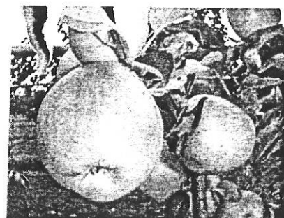
Pomme de l'Estre