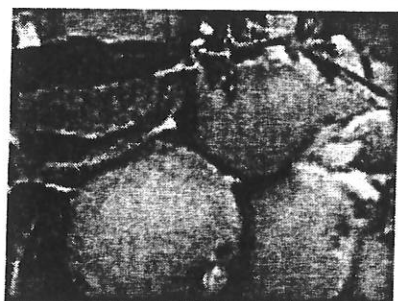
Azérolis anisé

Ces observations devront être comparées aux références déjà acquises et compilées, notamment sur le site http://1000pom.free.fr