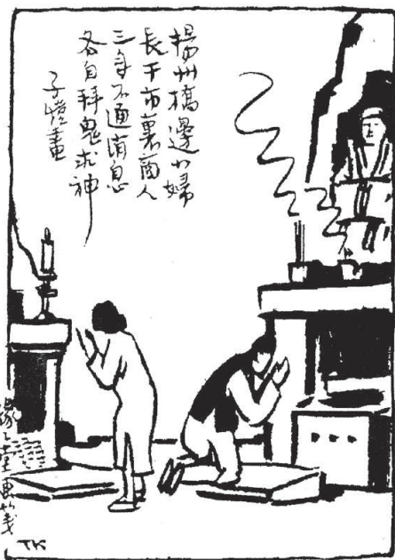
揚州橋邊小婦，長干市里商人。三年不通消息，各自拜鬼求神。

Illustration 7 : Feng Zikai, « La jeune femme du pont de Yangzhou et le marchand de la cité de Changgan, restés trois ans sans nouvelles, prient chacun les fantômes et les dieux » (1948)