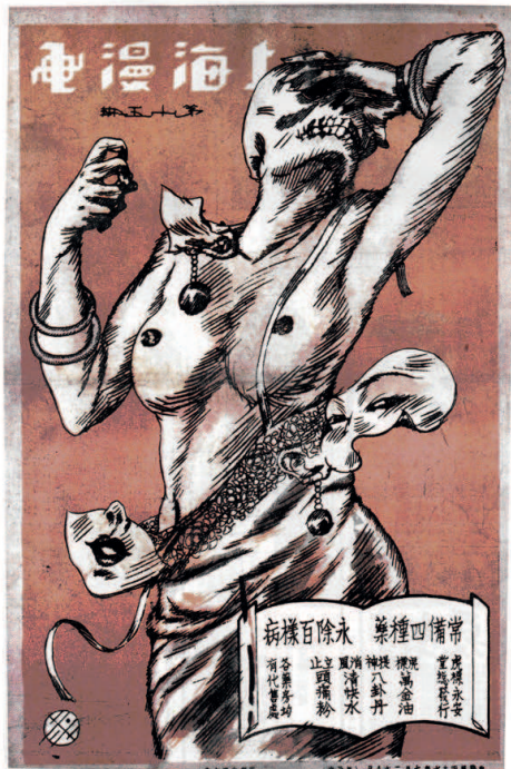
Illustration 6 : Shanghai Sketch n° 15, 20 juillet 1928, illustration de couverture par Ye Qianyu

Feng Zikai, qui de toute évidence ne partageait pas ses goûts pour « la sensualité, le symbolisme, l'imaginaire de l'amour légal 41 », ne semble pas avoir fait partie de son cénacle. Une illustration de couverture réalisée par le jeune Ye Qianyu en 1928 pour Shanghai Sketch fait directement écho à la fascination du poète pour le thème de la femme fatale, l'un des motifs majeurs de la revue, qui était aussi une métaphore de la décadence urbaine. Le titre Shanghai manhua tracé dans un style géométrique typiquement Art Déco accompagne un dessin coloré de style très occidentalisé : une élégante aux formes sinueuses à demi-nue, pourvue de bracelets de jade et de lourds pendants d'oreilles, se disloque sous nos yeux. Son visage est tombé comme un masque, dont on aperçoit les débris, pour révéler son squelette, tandis qu'elle renverse la tête en arrière en cachant ses yeux de la main dans une attitude de désespoir [ill. 6]. Pour le lectorat de