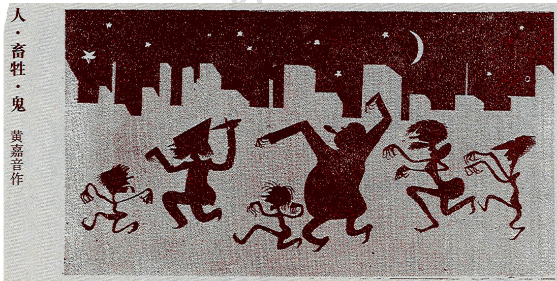
Illustration 5 : Modern Sketch , n° 9, 20 septembre 1934

L'article est agrémenté de plusieurs caricatures, dont l'une montre des silhouettes dansantes aux longs doigts crochus, au nez pointu et aux cheveux ébouriffés évoluant d'un pas pressé sous la lune et les étoiles devant un skyline urbain [ill. 5]. Un autre dessin, légendé « Fantômes d'ici-bas » ( Renjian de gui 人間的鬼), vient illustrer la théorie, énoncée dans l'article en regard, selon laquelle hommes, animaux et fantômes peuvent parfois se confondre. Un fumeur d'opium décharné est surmonté de quatre visages, dont l'un est une tête de mort et les trois autres, hirsutes, laissent apparaître une langue pendante et des canines proéminentes 35 .