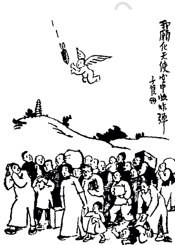
Illustration 4 : Feng Zikai, « Je voudrais me transformer en ange pour arrêter les bombes dans les airs » (1940)

En évoquant ces motifs quelque peu exotiques que sont les sphinx et les anges, puis Jésus, Feng Zikai témoigne d'une perception globalisante de l'art. Ainsi, malgré la difficulté de représentation, il intègre parfois inopinément une figure d'ange à ses dessins, produisant une sorte d'« hybride chinois », pour reprendre la formule employée par Danielle Elisseeff dans un lumineux petit ouvrage analysant les phénomènes de métissages intellectuels et artistiques propres à la Chine 27 . Le dessin intitulé « Je voudrais me transformer en ange pour arrêter les bombes dans les airs » ( Wo yuan hua tianshi, kong zhong shou zhadan 我願化天使空中收炸彈, 1940) matérialise ainsi le rêve naïf de mettre fin à la guerre grâce à un angelot protecteur veillant sur un groupe de fugitifs en plein exode [ill. 4]. Ainsi, bien que non formé à la peinture chinoise traditionnelle, Feng Zikai la « réinvente » à