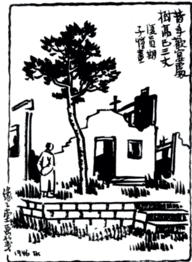
Illustration 3 : Feng Zikai, « Là où nous avons partagé de joyeux repas pousse maintenant un grand arbre » (1946)

Dans le monde réel, je n'ose affirmer que les fantômes existent, pas plus que je n'ose prétendre le contraire. J'ai lu ou entendu tant d'histoires de fantômes que je ne peux nier leur existence, mais n'en ayant jamais vu de mes yeux, je ne peux en avoir la certitude non plus. Pourtant, dans le domaine de l'imagination, leur existence ne fait pas de doute, parce que j'en aperçois souvent, c'est-à-dire qu'à chaque fois que je