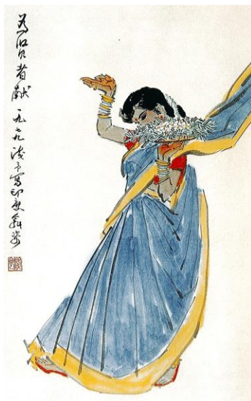
Fig. 2 : Ye Qianyu, 印度献花舞 (L'offrande de fleurs indienne), 1960, 139 x 65,5 cm, encre et couleurs sur papier (Académie centrale des beaux-arts, Pékin)