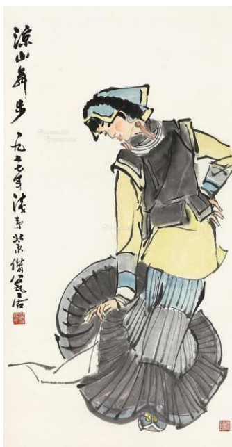
Fig. 5 : Ye Qianyu, 凉山舞步 (Pas de danse de Liangshan), 1963, 68,7 x 45,3 cm, encre et couleurs sur papier (Musée Ye Qianyu, Tonglu, province du Zhejiang)

Quand je peins une figure de danseuse, je recrée l'art de la danse. Ma peinture conserve la personnalité [ gexing 个性] de la danseuse, mais pas seulement, j'y mets aussi de ma subjectivité. Ainsi, ma peinture exprime-t-elle à la fois la personnalité de la danseuse et la mienne 22 .