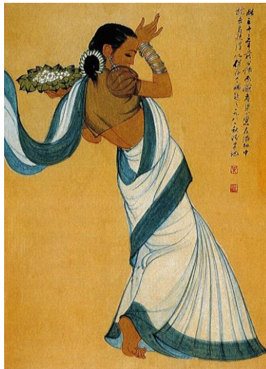
Fig. 1 : Ye Qianyu, 印度献花舞 (L'offrande de fleurs indienne), 1949, 52 x 71 cm, encre et couleurs sur papier (Musée des beaux-arts de Chine, Pékin)

miniatures indiennes (Fig. 1). Les aplats de couleur y sont légèrement ombrés pour montrer l'effet de la lumière. On devine là encore l'influence des apsaras et des joueuses de pipa des fresques de Dunhuang. Ici, la figure est coupée, comme si elle n'était pas complètement entrée en scène. Ye Qianyu y apposera en 1981 l'inscription : « C'est une œuvre ancienne réalisée il y a trente-trois ans. La collectionneuse Liang Xiaoqing a pu la conserver en effaçant ma signature durant toutes ces années difficiles. J'y ajoute aujourd'hui cette inscription » 3 . En 1962, avec l'irruption brutale de la géopolitique dans le monde de l'art, lors d'un conflit opposant la Chine et l'Inde, l'œuvre fut accusée de vouloir s'attirer les bonnes grâces de l'ennemi.