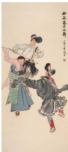
Fig. 3 : Ye Qianyu, 西藏高原之舞 (Danse sur le plateau tibétain), 1960, 133 x 66,4 cm, encre et couleurs sur papier (Musée Ye Qianyu, Tonglu, province du Zhejiang)