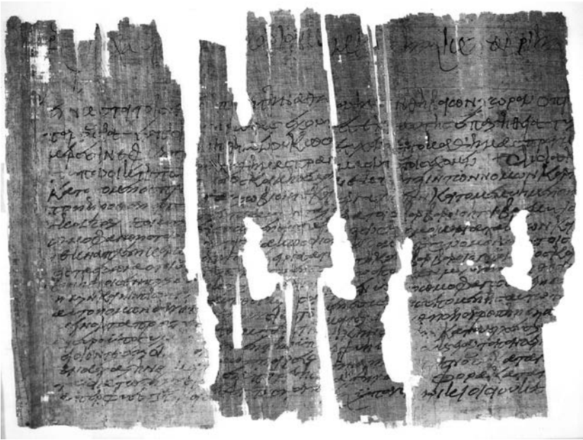
Fig. 2 : Plainte des sénateurs de la ville d'Omboi contre un païen (567).

Un des uniques papyrus tardifs documentant les faits et gestes d'un païen est une plainte conservée par un papyrus que les sénateurs de la ville d'Omboi présentèrent en 567 au duc de Thébaidé (fig. 2) 1