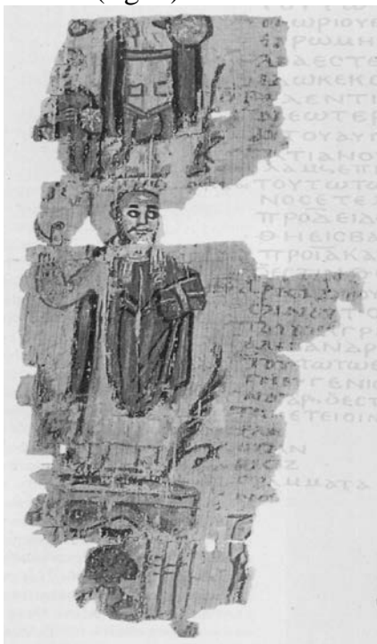
Fig. 1 : L'évêque Théophile piétinant symboliquement le Sérapéum (dont on voit le haut de la tête de la statue de Sérapis) après sa destruction. Illustration de l'« Alexandrian World Chronicle » (V e -VI e s.), Moscou, Musée Pushkin, inv. 310/8, verso.

mettre à bas ce temple ainsi que d'autres édifices païens : d'après les témoignages des historiens de l'Église Socrate et Sozomène, il aurait commencé par investir des temples et bafouer leurs objets liturgiques, provoquant des émeutes chez les païens, qui, sous le commandement du philosophe néoplatonicien Olympios, auraient occupé le Sérapéum en le transformant en une base offensive ; les chrétiens fanatisés par l'évêque et les militaires font tomber cette citadelle et détruisent le Sérapéum en 391 (fig. 1).