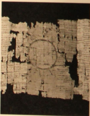
Fig. 87 PSEUDO-EUDOXE, Art astronomique Paris, Louvre, Département des Antiquités égyptiennes (N2325 = P. Paris 1) Sarapieion de Memphis (Égypte) Peu avant 164 av. J.-C. Grec Papyrus; encre noire avec rehauts de jaune sur certaines figures 271,5 x 30 cm; r: 24 col. (544 L), v: 13 col. Copiste inconnu