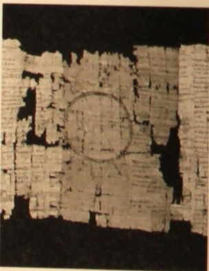
Fig. 87 PSEUDO-EUDOXE, Art astronomique Paris, Louvre, Département des Antiquités égyptiennes (N2325 = P. Paris 1) Sarapieion de Memphis (Égypte) Peu avant 164 av. J.-C. Grec Papyrus; encre noire avec rehauts de jaune sur certaines figures 271,5 x 30 cm; r: 24 col. (544 L), v: 13 col. Copiste inconnu

Tous les écoliers, encore aujourd'hui, doivent apprendre à maîtriser le théorème de Pythagore: il permet de calculer la longueur d'un des côtés d'un triangle rectangle à partir de la longueur des deux autres. D'une application relativement simple, ce théorème peut être utilisé par exemple en architecture, et aussi pour mesurer des terrains. C'est peut-être ce second usage qui aura justifié qu'on l'enseigne à des élèves de l'Égypte romaine: en effet, dans un contexte agricole où les terrains changeaient de configuration au gré des crues du Nil, les autorités fiscales ont dû consacrer une énergie considérable à des opérations de cadastre.