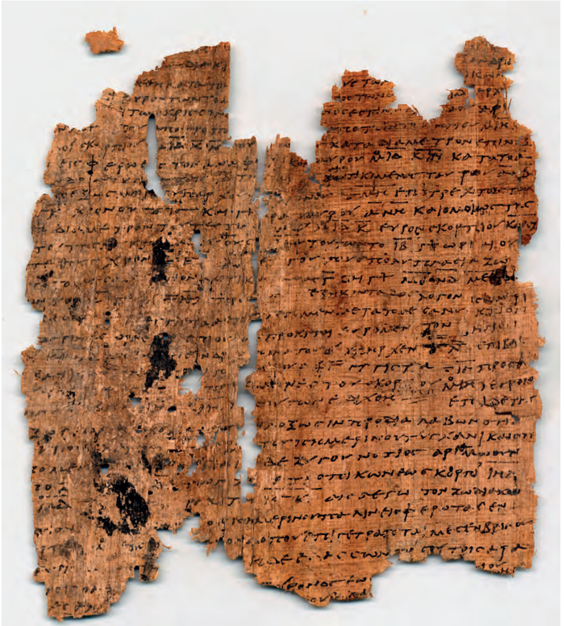
P. Fouad inv. 267A, v°.