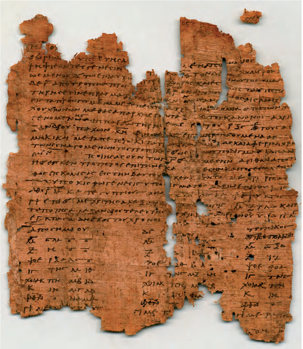
P. Fouad inv. 267A, r o .