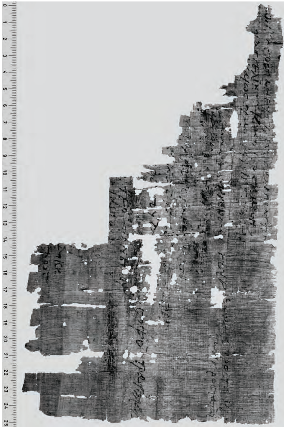
No. 26, verso