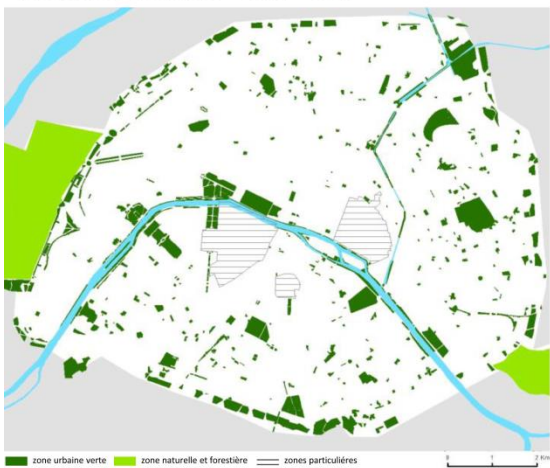
Plan Local d'Urbanisme – Paris – 2006