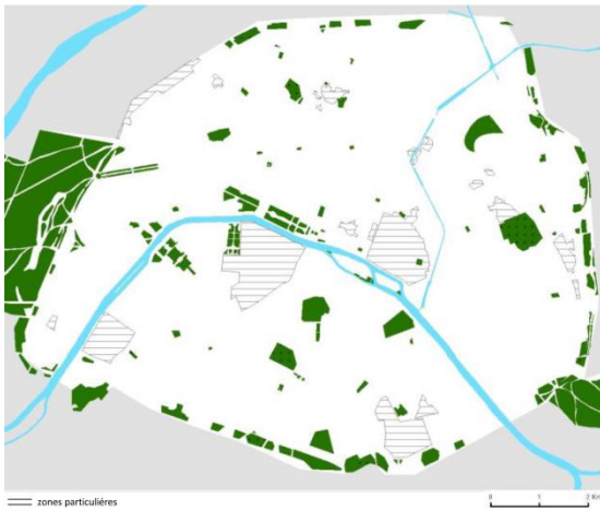
Plan d'Occupation des Sols – Paris – 1977