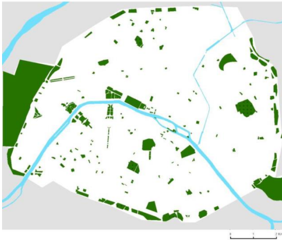
Plan d'Urbanisme Directeur – Paris – 1967