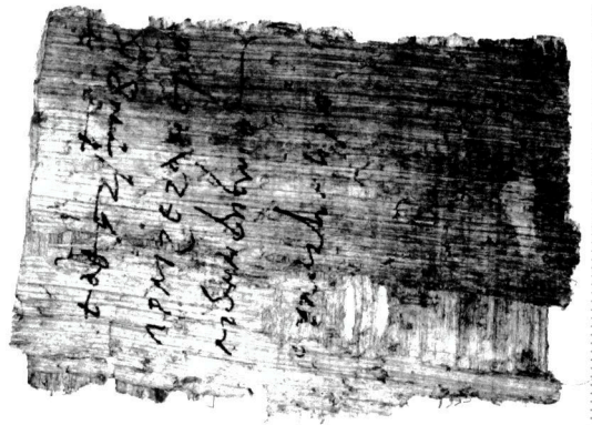
Nr. 465. Wainmirung