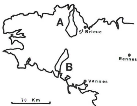
Fig. 1 - Situation en Bretagne des deux bassins versants du Trieux (A) et du Scorff (B).

Les deux rivières retenues, le Trieux dans les Côtes du Nord et le Scorff dans le Morbihan (Fig. 1) sont très comparables géographiquement (tableau 1).