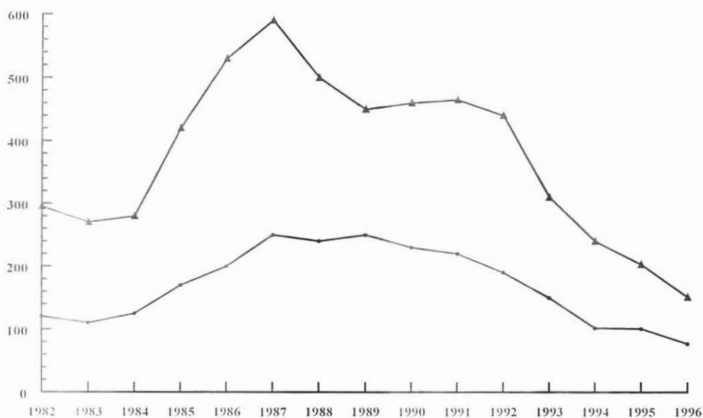
Graphique 1. Evolution des aides publiques à l'irrigation de 1982 à 1996 (en millions de F aux prix de 1980 : moyennes triennales)

Mais, même en faisant abstraction des externalités, on sait que les agriculteurs ne supportent pas le coût intégral de l'irrigation. En effet, la collectivité prend en charge une partie des dépenses liées à la mobilisation de la ressource, au niveau du stockage et éventuellement des ouvrages de distribution de l'eau. Ces aides prennent la forme de subventions dont près de la moitié reviennent aux Sociétés d'Aménagement Régional, comme l'indique le graphique n° 1. Historiquement, on voit que les subventions ont atteint un sommet, vers la fin des années 80. Aujourd'hui, on se retrouve à des niveaux inférieurs à ceux du début des années 80.