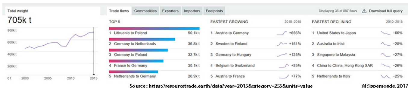
Figure 2. Informations complémentaires présentées sous la carte interactive.

Dans le cas de l'amidon de blé, ce sont donc 57 flux sur 887 qui sont représentés, soit seulement 6% de l'ensemble. Compte tenu qu'une carte de flux devient très vite illisible lorsqu'elle est trop chargée, ce filtrage automatique des liens est plutôt positif. On peut toutefois regretter que l'utilisateur n'ait pas la possibilité de régler lui-même le seuil. Heureusement, les données complètes peuvent être téléchargées par un simple clic au format Excel.