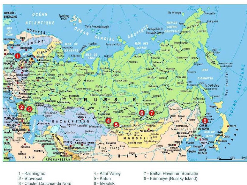
Carte 1. Les zones économiques spéciales de tourisme en Russie en 2010

Conception et réalisation : E. Andreeva-Jourdain (2014).