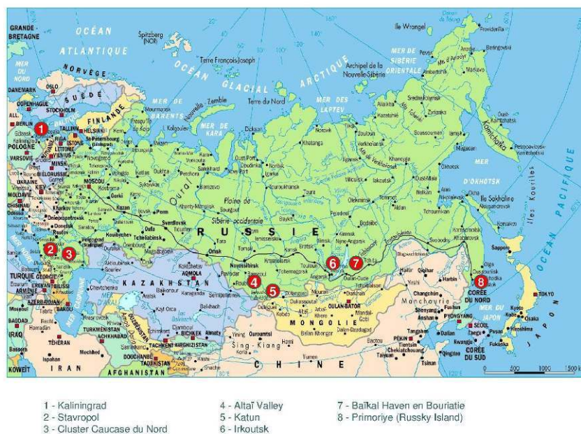
Carte 1. Les zones économiques spéciales de tourisme en Russie en 2010

Conception et réalisation : E. Andreeva-Jourdain (2014).