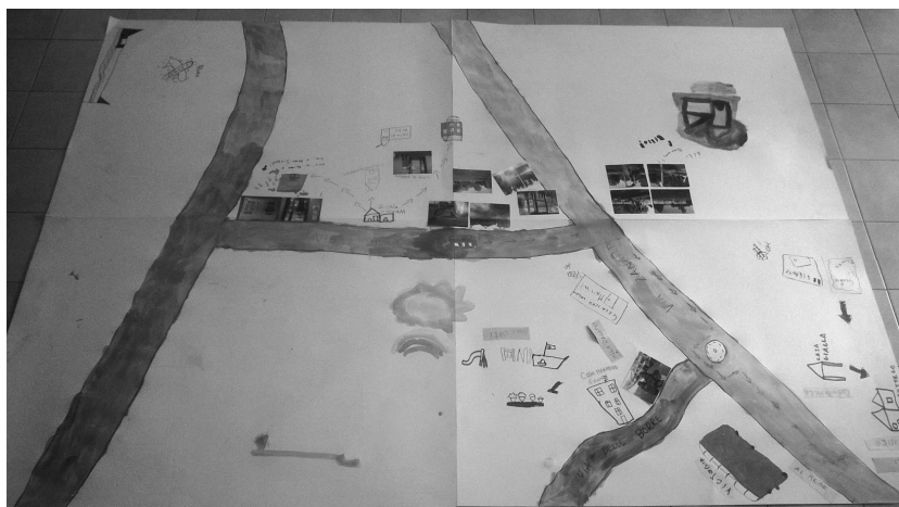
Mappa dei luoghi frequentati e significativi realizzata con ille bambinile del centro socio-educativo

La raccolta dei dati è stata impostata tramite un'integrazione di discipline e prospettive differenti, avvalendosi di metodi qualitativi (diari, interviste, focus group ) e quantitativi (database socio-demografici e sanitari). La fase di analisi, al momento in programmazione, sarà condotta in forma partecipata e volta a un confronto tra documentato e percepito, come base da cui partire per l'elaborazione di strategie che chiamino in causa anche le istituzioni e la rete dei servizi.