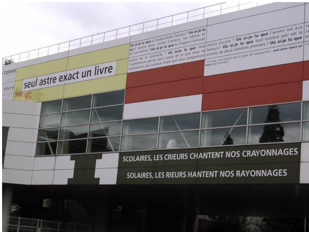
Figure 2 : Le mur littéraire de la bibliothèque universitaire de Paris 8 en seine Saint-Denis - un exemple littéraire de l'application du 1 % culturel