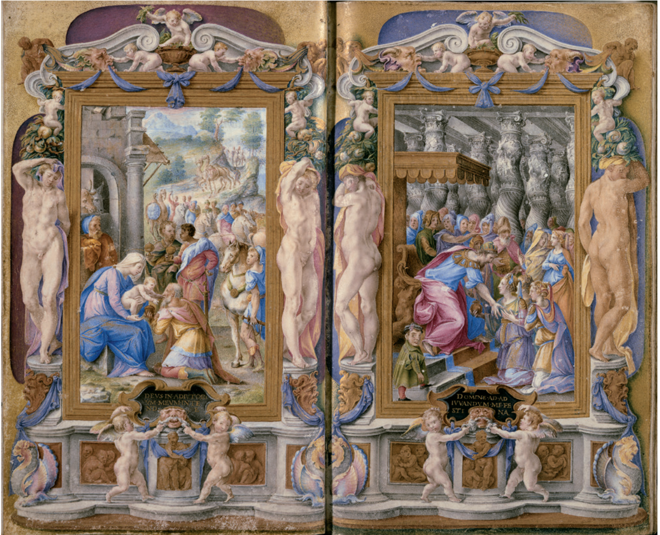
1 Giulio Clovio, Heures Farnèse, fol. 38v-39r: L'adoration des mages et Salomon rencontrant la reine de Saba. The Pierpont Morgan Library, New York, Ms M.69