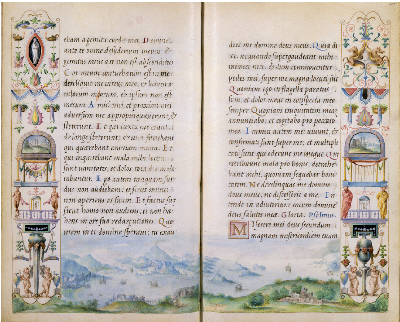
18 Giulio Clovio, Heures Farnèse, fol. 66v-67r: Paysage avec grotesques. New York, The Pierpont Morgan Library, Ms M.69