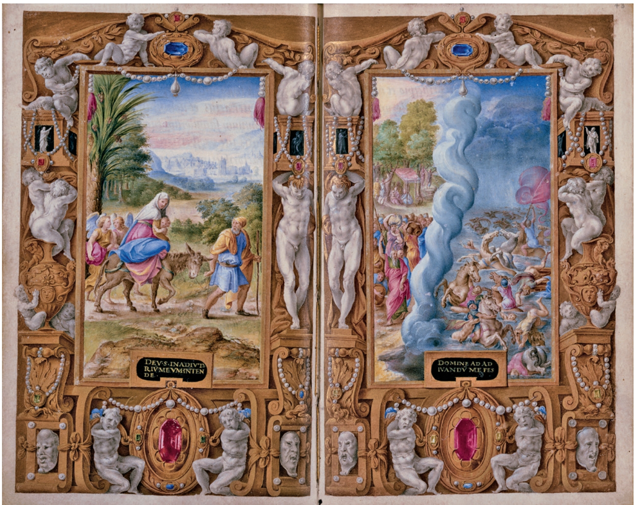
16 Giulio Clovio, Heures Farnèse, fol. 42v-43r: La fuite en Égypte et Le passage de la mer Rouge. New York, The Pierpont Morgan Library, Ms M.69