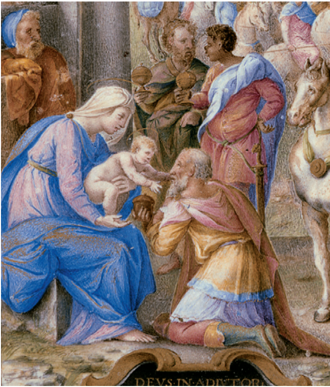
8 Giulio Clovio, Heures Farnèse, fol. 38v: L'adoration des mages, détail. The Pierpont Morgan Library, New York, Ms M.69