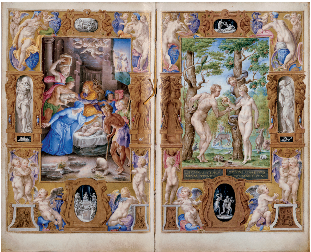
11 Giulio Clovio, Heures Farnèse, fol. 26v-27r: La Nativité et Le péché origine . New York, The Pierpont Morgan Library, Ms M.69