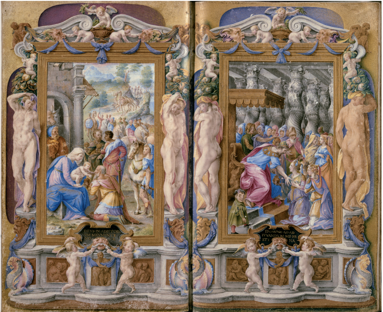
1 Giulio Clovio, Heures Farnèse, fol. 38v-39r: L'adoration des mages et Salomon rencontrant la reine de Saba. The Pierpont Morgan Library, New York, Ms M.69