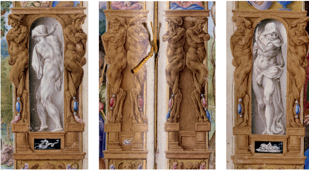
14a-c Giulio Clovio, Heures Farnèse, fol. 26v-27r: La Nativité et Le péché originel , détails. New York, The Pierpont Morgan Library, Ms M.69

Le comique remplit essentiellement deux fonctions dans le cadre de notre manuscrit, l'une dévotionnelle, l'autre oratoire. Dans les deux cas, le jeu érudit ne vise pas à distraire mais à provoquer un sourire chez le lecteur qui prend conscience de la plaisanterie. Le plaisir provoqué instaure un climat de connivence entre le spectateur et l'objet contemplé, encourageant de cette manière la compréhension de ce dernier. 51 Le statut ambivalent de cardinal, à la fois membre de la curie romaine et haut dignitaire d'une cour mondaine, oblige celui-ci à maîtriser cet aspect de la rhétorique cicéronienne, surtout à cette époque de turbulences pour l'église catholique. Paolo Cortesi 52 et Baldassarre Castiglione 53 ont tous les deux souligné dans leurs écrits l'importance de l'emploi des formules humoristiques