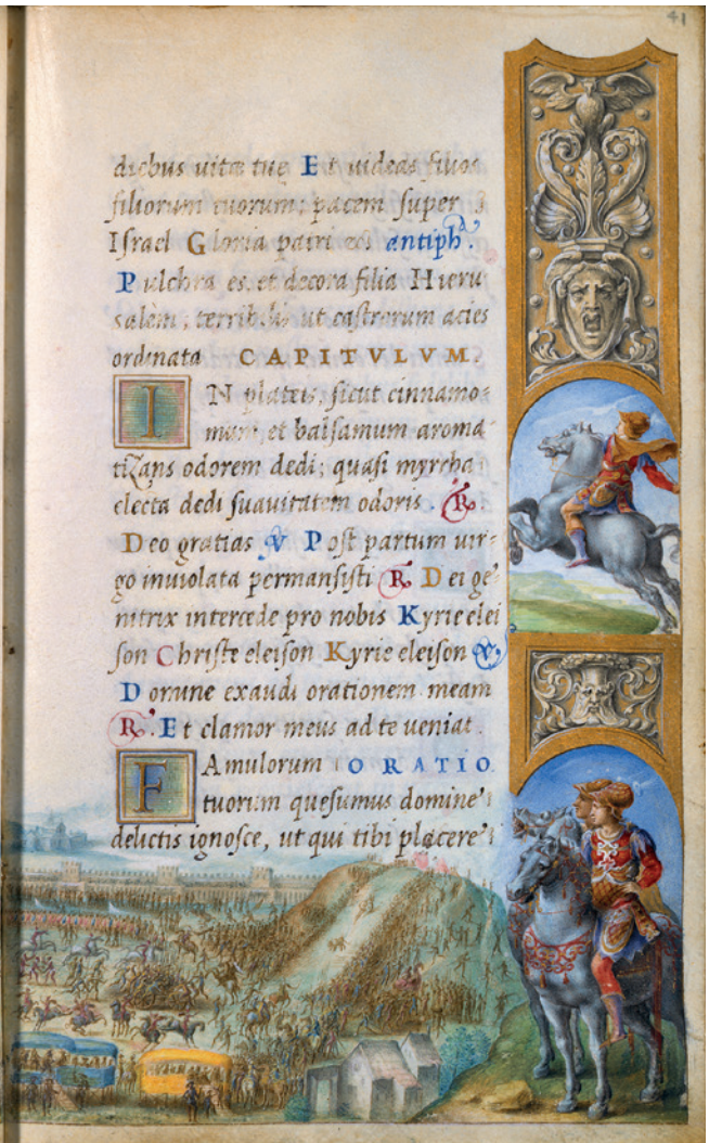
5 Giulio Clovio, Heures Farnèse, fol. 39r: Salomon rencontrant la reine de Saba , détail. New York, The Pierpont Morgan Library, Ms M.69