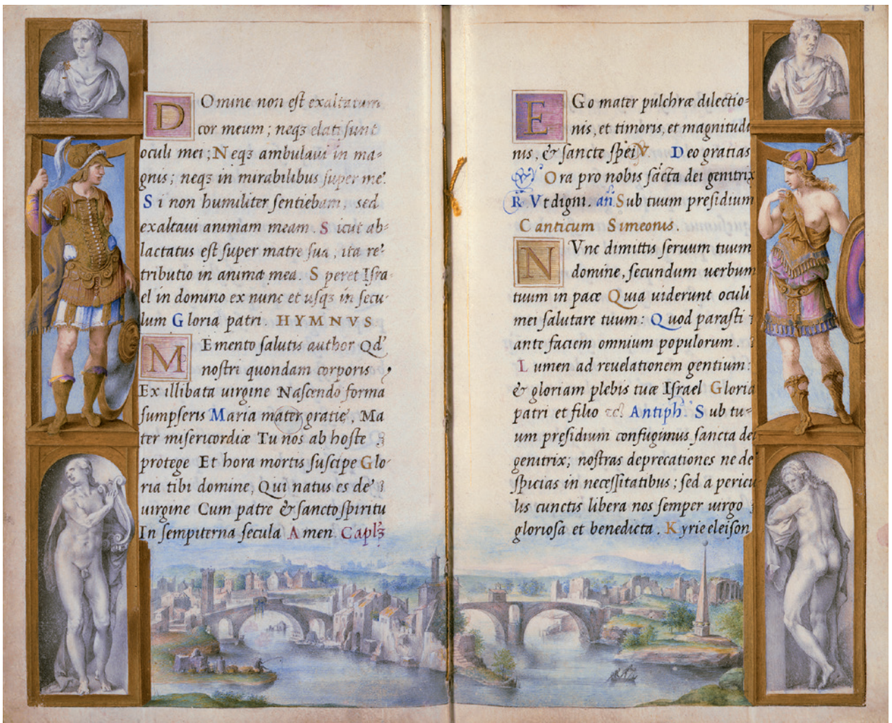
10 Giulio Clovio, Heures Farnèse, fol. 50v-51r: Paysage avec l'île du Tibre. New York, The Pierpont Morgan Library, Ms M.69