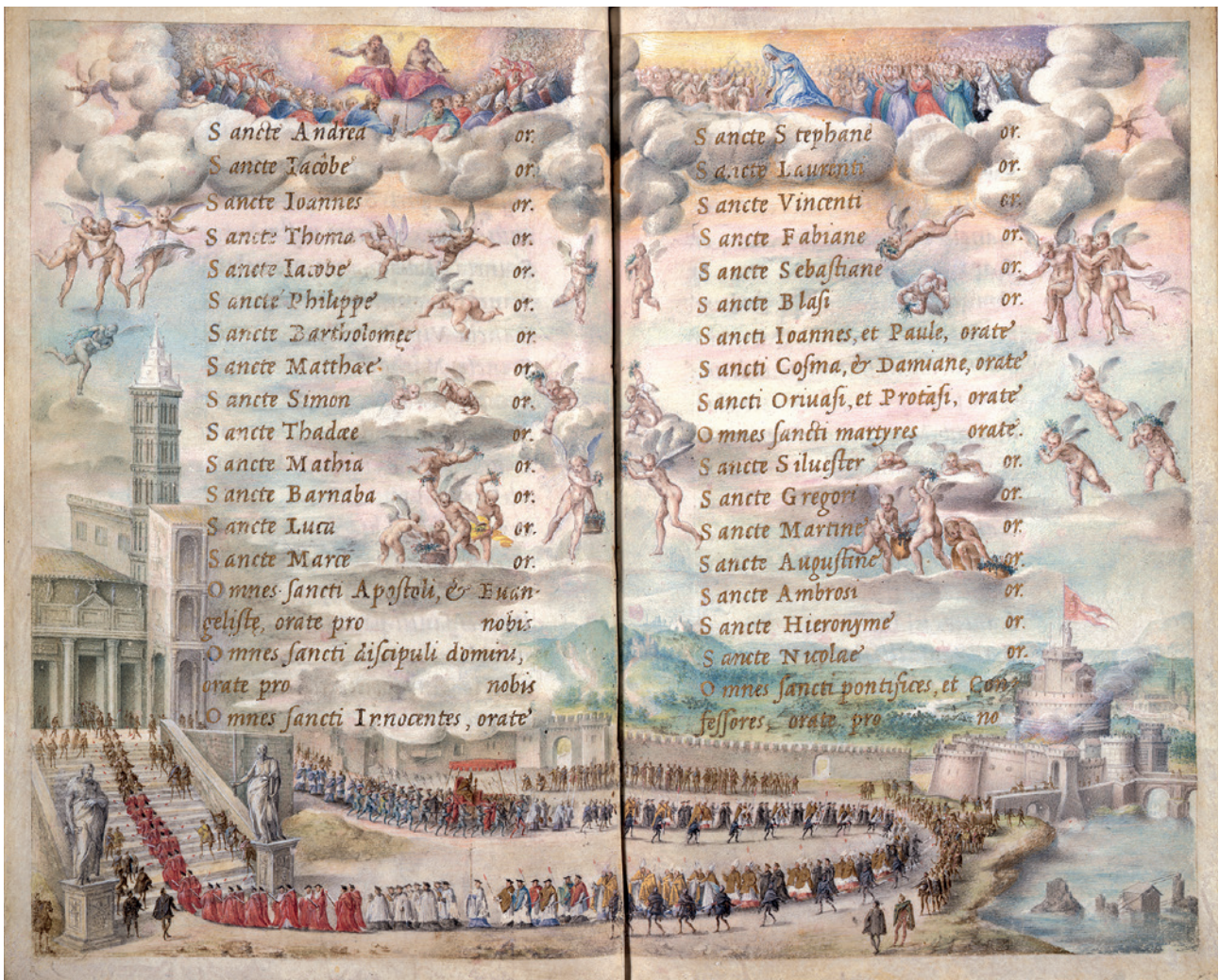
19 Giulio Clovio, Heures Farnèse, fol. 72v-73r: Procession du Corpus Christi . New York, The Pierpont Morgan Library, Ms M.69