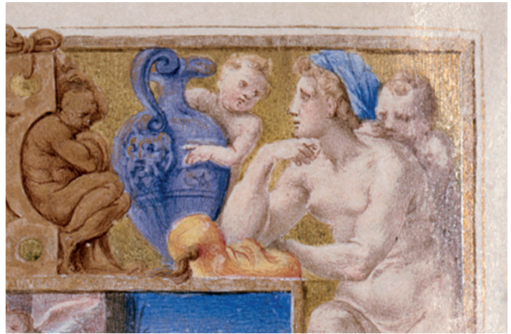
12 Giulio Clovio, Heures Farnèse, fol. 27r: Le péché originel , détail. New York, The Pierpont Morgan Library, Ms M.69