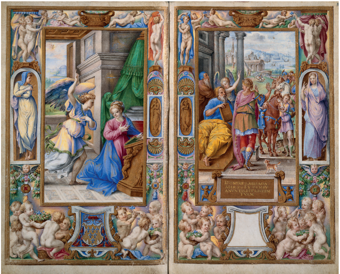
3 Giulio Clovio, Heures Farnèse, fol. 4v-5r: L'Annonciation et La prophétie d'Isaïe au roi Achaz . New York, The Pierpont Morgan Library, Ms M.69