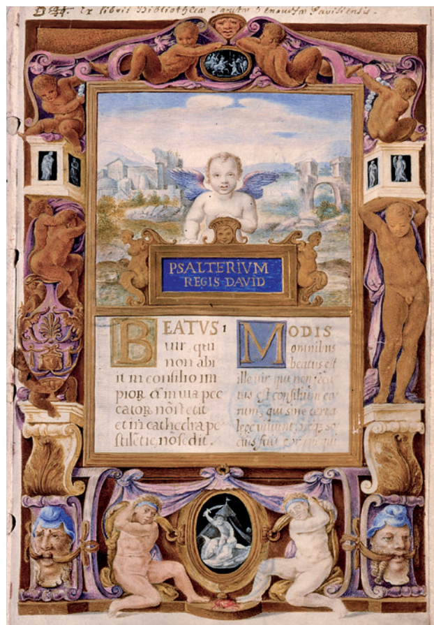
17 Giulio Clovio, frontispice de la Paraphrase des Psaumes de David . Paris, Bibliothèque Sainte-Geneviève, Ms 1201, p. III