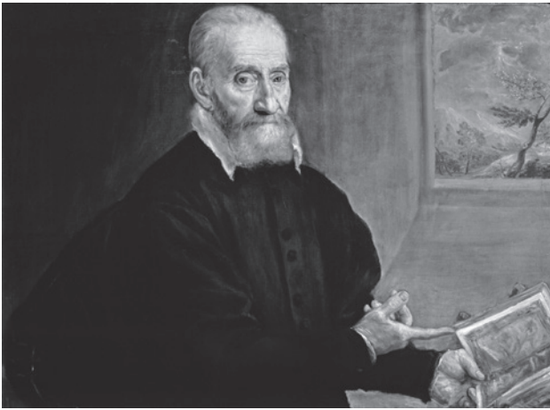
2 El Greco (Domenikos Theotokopoulos), Portrait de Giulio Clovio. Naples, Museo Nazionale di Capodimonte

mettant en place un système décoratif dont les composants opèrent à travers deux traditions qui se contaminent mutuellement.