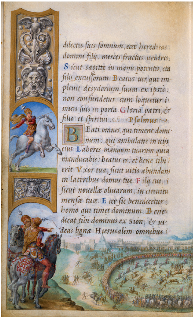
4 Giulio Clovio, Heures Farnèse, fol. 40v-41r: Fête du Monte Testaccio . New York, The Pierpont Morgan Library, Ms M.69