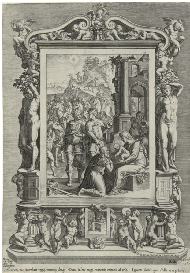
15 Cornelis Cort d'après Giulio Clovio, L'adoration des mages . Amsterdam, Rijksmuseum, inv. RP-P-OB-7138

Celui des feuillets 42v–43r (fig. 16) est tellement discret que l'on pourrait le qualifier de ruse de la représentation. Avec un relief accentué par l'architecture feinte en saillie, les frontispices mettent littéralement en avant leur décoration somptueuse et surtout la profusion des perles. Les putti , situés à gauche et à droite des coins supérieurs, font passer les colliers de perles à travers le cadre et sur le plan de la storia . L'animation de l'inanimé, le geste calculé des putti et surtout l'absence de logique plastique instaurent un excès qui fonctionne "à trop forte puissance ". 67 Au premier abord, cela crée un conflit sur le plan de la représentation. Les perles placées sur la storia suggèrent une superposition des plans,