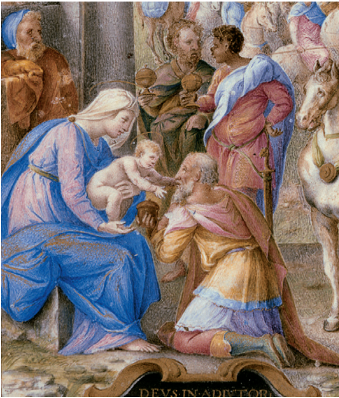
8 Giulio Clovio, Heures Farnèse, fol. 38v: L'adoration des mages, détail. The Pierpont Morgan Library, New York, Ms M.69