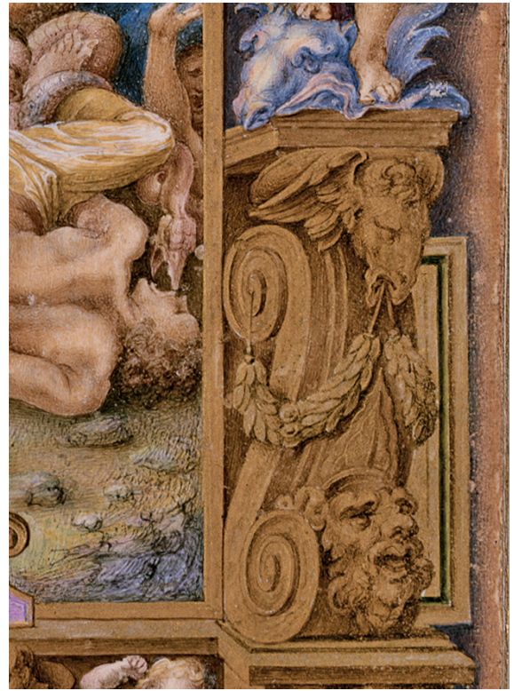
9 Giulio Clovio, Heures Farnèse, fol. 103r: Le serpent d'airain, détail. New York, The Pierpont Morgan Library, Ms M.69

parition dans les Heures Farnèse, où la métaphore de la galleria encourage les comparaisons entre les différents types d'objets et matériaux placés les uns à côté des autres. En prenant en considération la place centrale de la question du paragone dans le contexte artistique et théorique du XVI e siècle, il semblerait que Clovio ait été tenté de fournir ses propres propositions. L'appartenance de l'artiste aux cercles de l'Accademia dello Sdegno, 27 ainsi que ses rapports avec Francisco de Hollanda qui, dans ses Dialogues , soutenait la primauté