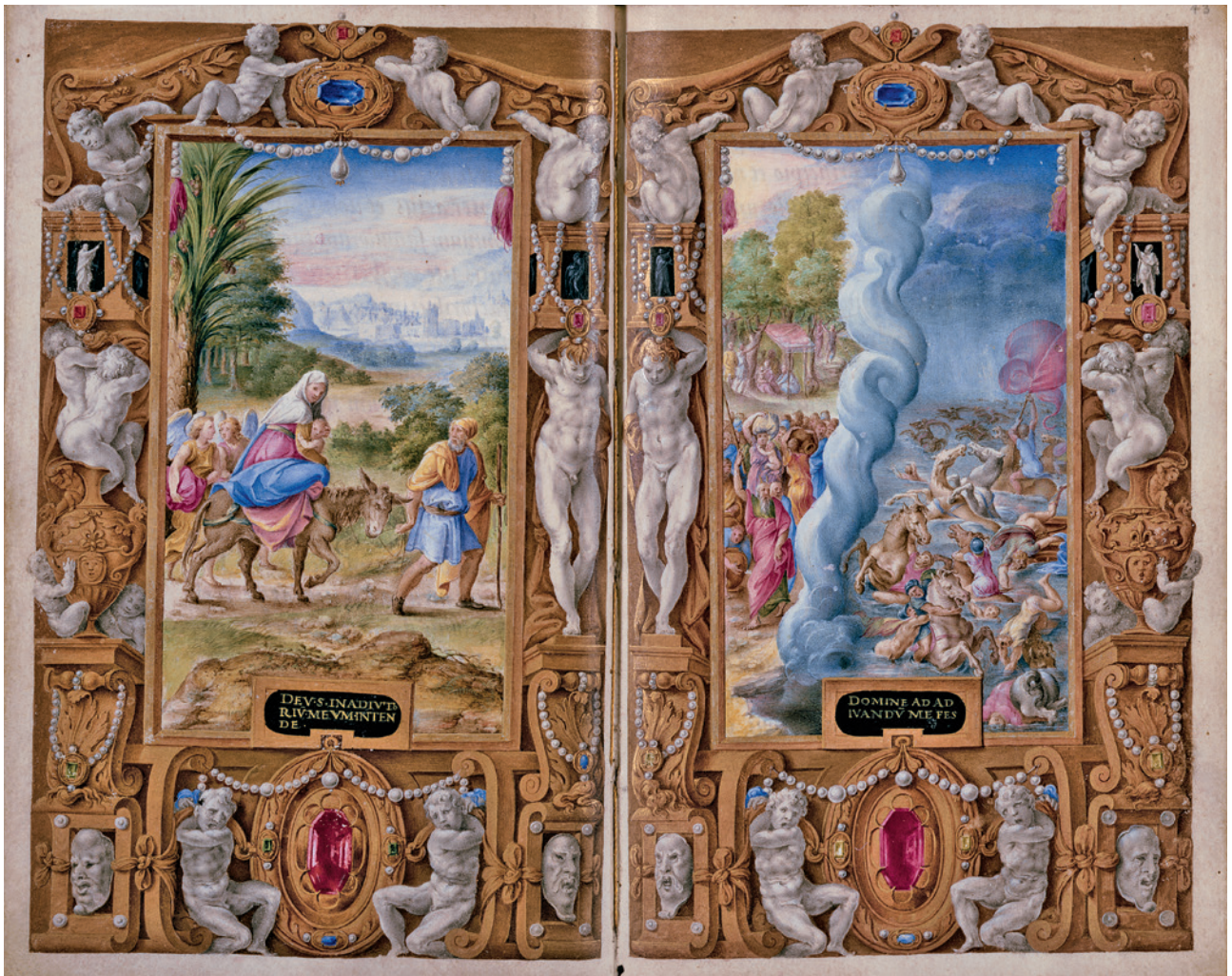
16 Giulio Clovio, Heures Farnèse, fol. 42v-43r: La fuite en Égypte et Le passage de la mer Rouge. New York, The Pierpont Morgan Library, Ms M.69