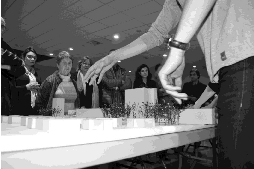
Figure 4: la maquette comme dispositif de négociations

Le partage, notion commune à l'expérience des itinéraires, des maquettes in situ , du plateau radio comme de l'hébergement chez l'habitant, nous invite à revoir nos fondements tant pédagogiques qu'urbanistiques. En ce sens, le jeu – où se combine l'intérêt d'opérer avec le plaisir de coopérer – a à voir avec le potlatch (Mauss, 2012), un système de dons / contre-dons dans le cadre d'échanges non marchands. Le jeu, dépense pure dans sa vocation première, est aussi l'occasion d'une remise à plat des enjeux économiques et sociaux. C'est comme nous l'avons vu le début d'une nouvelle cristallisation de rapports aux territoires, une nouvelle mise en jeu.