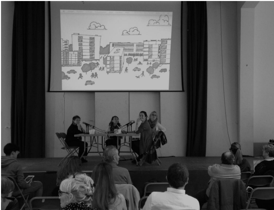
Figure 3: le plateau radio