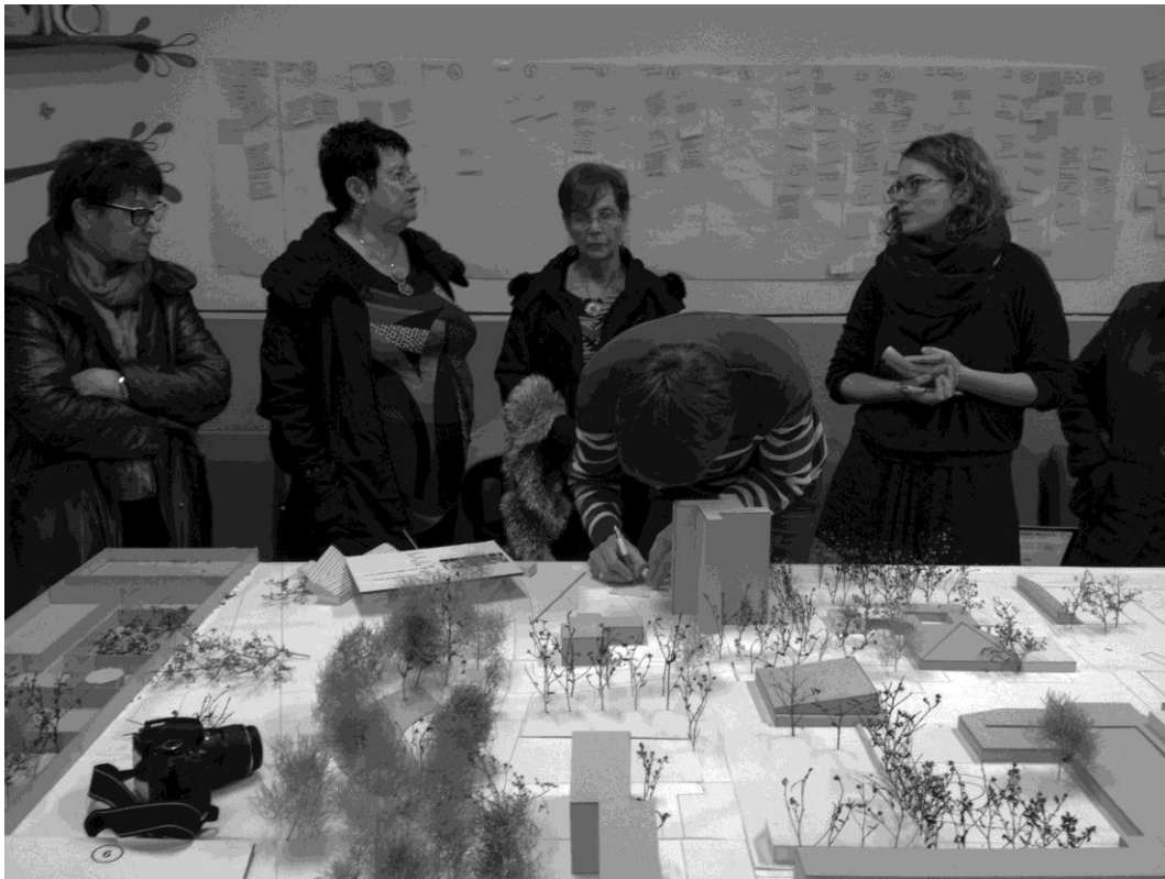
Figure 3 : les habitants, les étudiants et leurs maquettes