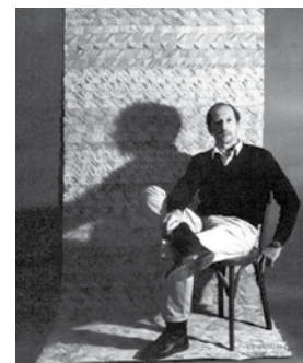
Lagoutte Claude, Lettres d'Inde , 1979-80. Carnet de voyage, 310 x 230 mm (déplié 310 x 16560 mm) papier teinté avec terres, poudres, thé, café ; textes et dessins à l'encre noire, collages. Bibliothèque Municipale de Bordeaux.