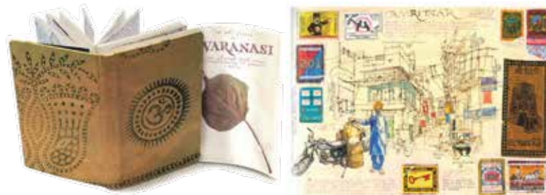
Stefano Faravelli, carnet original et page intérieure pour l'ouvrage India, per vedere l'elefante , Carnet di viaggio , éd. EDT, Turin, 2007