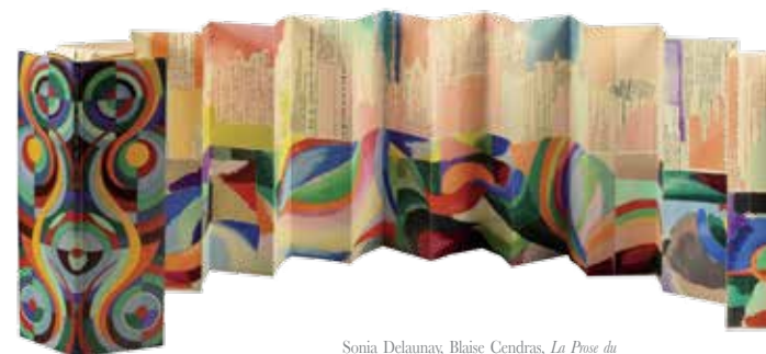
Sonia Delaunay, Blaise Cendrars, La Prose du Transsibérien et de la Petite Jehanne de France . Éditions des Hommes Nouveaux, 1913. 4 feuilles in-folio (environ 500 x 359 mm), assemblées en 22 volets pliés en accordéon, 150 ex.