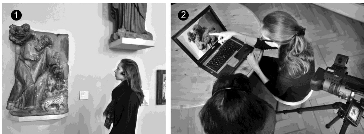
Figure 1. Les entretiens réalisés en re-situ subjectif ❶ Le visiteur est équipé d'une caméra miniature puis laissé à sa visite naturelle. ❷ À l'issue de la visite, il est invité à décrire son expérience à partir de l'enregistrement vidéo de sa perspective visuelle tandis qu'une caméra placée derrière lui enregistre la vidéo subjective, cette fois avec les commentaires et les gestes du visiteur.

L'enregistrement vidéo de l'entretien est ensuite retranscrit à partir d'un logiciel de partage d'annotations adapté aux besoins des enquêtes (Aubert, Prié, & Schmitt, 2012) 2 . Ce dernier permet de construire un document hypervidéo où la vidéo de l'entretien, sa transcription et les annotations du chercheur sont synchronisées. Chaque séquence signifiante de l'activité décrite par le visiteur peut être considérée comme la manifestation d'un signe qui comporte six composantes (Theureau, 2006). Cette méthode d'analyse s'inscrit dans le courant de l'approche située (Barbier & Durand, 2003). Ainsi, nous cherchons pour chaque séquence signifiante à identifier ce qui est perçu ou pris en compte, les attentes, les savoirs mobilisés, la façon de se lier au monde perçu, les connaissances construites et nous indiquons la valence émotionnelle déclarée par le visiteur.