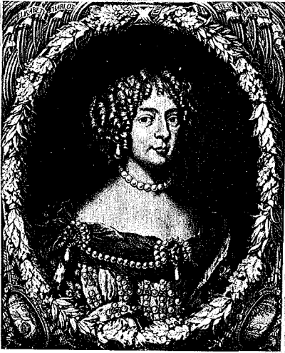
45 - 1 er état