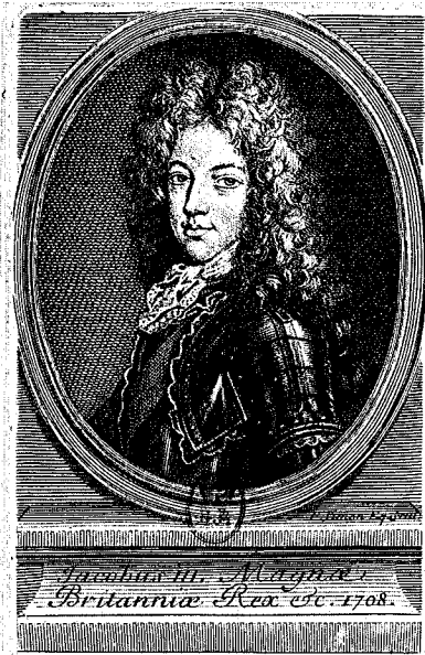
25 - 1 er état