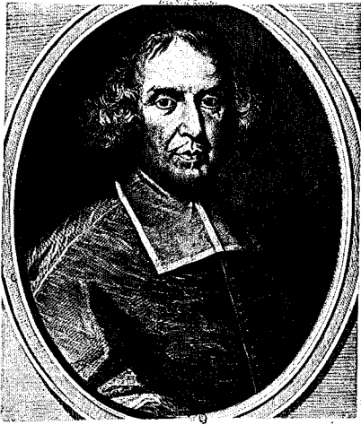
53 - 1 er état