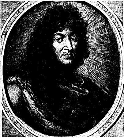
35 - 2 e état