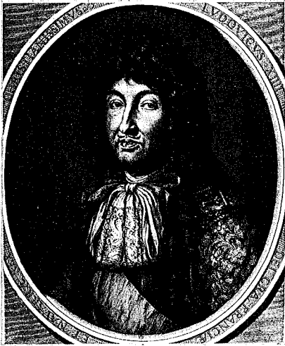
33 - 1 er état