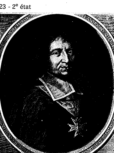
23 - 2 e état