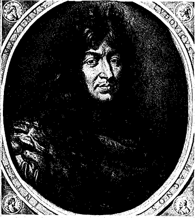
35 - 5 e état