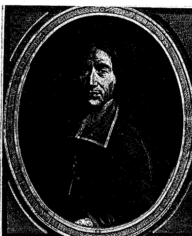
22 - 2 e état