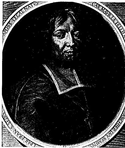
28 - 2 e état