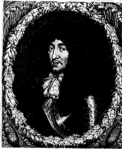
46 - 1 er état