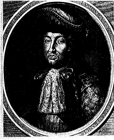
33 - 3 e état

une allusion à la Révocation de l'Edit de Nantes.