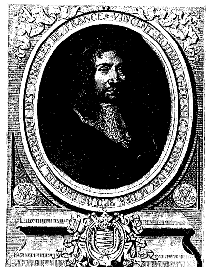
24 - 2 e état