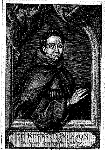
50 - 2 e état

N° 52 — RAGUIER DE POUSSE (ANTOINE), d'après Nicolas Guerry (admis. à l'Académie de Saint-Luc à Paris le 8 octobre 1674).