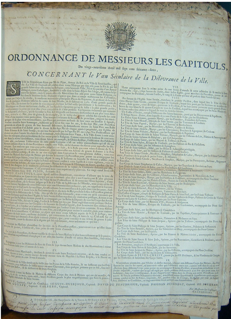
Ordonnance des capitouls sur la procession du 17 mai 1762 – 29 avril 1762

Les magistrats municipaux édictaient également des ordonnances dans lesquelles ils donnaient l'ordre de la procession, ce dernier étant, comme toute manifestation de ce type sous l'Ancien Régime, l'occasion de conflits multiples entre les groupes sociaux de la ville, corporation de métier, gens de justice, ecclésiastiques. Il n'est pas lieu de s'étendre sur ces conflits de préséance qui relèvent davantage de l'ordre civique que de la mémoire confessionnelle, mais le placard ci-dessous permet de situer la procession dans des pratiques citadines habituelles :