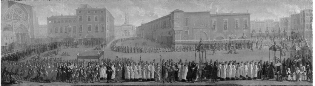
Jean II MICHEL, La procession des corps saints à Toulouse, vers 1700 Huile sur toile – Musée des Augustins de Toulouse

Son parcours traversait la ville en réunissant les deux lieux catholiques les plus importants de Toulouse : la cathédrale Saint-Étienne, d'où elle partait, et la basilique Saint-Sernin où elle arrivait. Entre les deux, elle passait devant l'hôtel de ville en prenant les principaux axes de la cité. Il existe une représentation de ce parcours probablement réalisée vers 1700 et montrant cette procession.