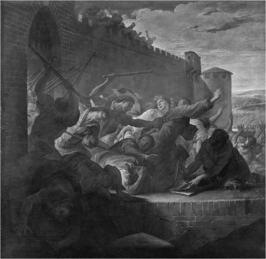
Antoine RIVALZ, Expulsion des huguenots de Toulouse , 1727 Huile sur toile, musée des Augustins, Toulouse

Voilà ce que fut cette histoire toulousaine des événements de 1562 : elle fut écrite et réécrite, mais demeura au cœur des consciences de la ville dans sa forme initiale au moins jusqu'au XVIII e siècle. Comme épilogue à cette histoire, on pourrait ajouter l'oubli dans lequel elle est tombée de nos jours. Pour preuve, dans une réalisation d'envergure financée par la municipalité à la fin des années 1990, une série de tableaux sur les grandes dates de l'histoire municipale a été installée au plafond d'une galerie d'arcades de la place du Capitole de Toulouse. Ce programme fut mené par le peintre Raymond Moretti 36 , qui ne fit pourtant pas l'économie des heures sombres de la ville, notamment le temps de la croisade albigeoise. Pourtant, n'y figure pas l'épisode de 1562, signe d'une histoire aujourd'hui oubliée.