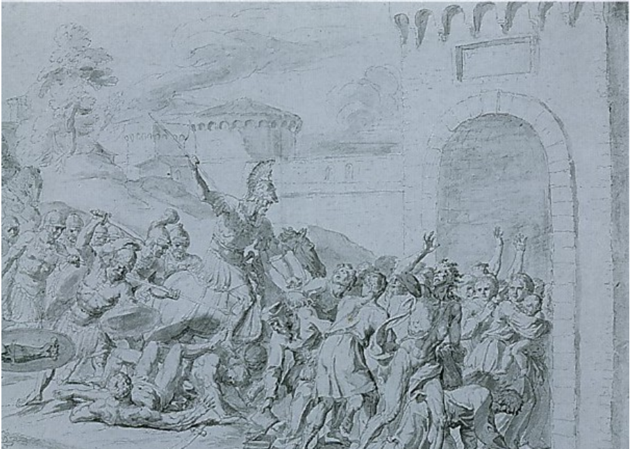
Raymond LAFAGE, Les huguenots chassés de Toulouse – v. 1683 Plume et lavis, Musée Paul Dupuy, Toulouse

Autre exemple de la permanence de cette mémoire, les choix iconographiques des capitouls de Toulouse dans le programme arrêté pour décorer les murs de l'hôtel de ville autour des éléments marquant de l'histoire municipale. L'entreprise fut lancée au début des années 1680 34 . Selon les grandes dates toulousaines définies par Germain de Lafaille, auteur de la révision de l'histoire municipale vue précédemment, les capitouls demandèrent aux artistes convoqués d'intégrer les événements de 1562. Le premier d'entre eux fut Raymond Lafage qui proposa aux capitouls dès 1683 des séries d'esquisses.