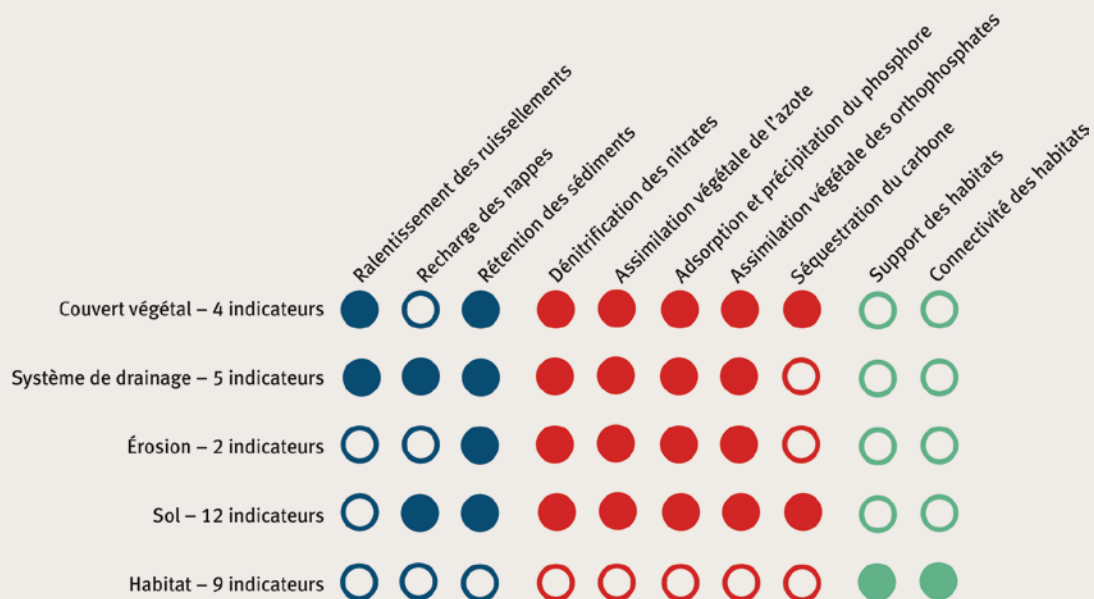
2 Composants structurels sur lesquels les indicateurs sont relevés pour l'évaluation des fonctions retenues dans la méthode. Les cercles pleins indiquent les fonctions renseignées (voir Gayet et al. 2016b pour plus d'information).

L'analyse de l'équivalence fonctionnelle exige l'intégration d'un ratio d'équivalence fonctionnelle qui tient compte de notions clés dans le domaine de la restauration écologique : incertitude du résultat prévu, délai pour obtenir les gains escomptés, durabilité des gains, trajectoire écologique, imprécision des évaluations... Ce ratio représente le rapport entre le gain fonctionnel et la perte fonctionnelle à dépasser pour conclure sur la vraisemblance d'une équivalence fonctionnelle. Par exemple, un ratio de 2/1 signifie que le gain fonctionnel sur le site de compensation doit être au moins deux fois plus important que la perte fonctionnelle sur le site impacté pour conclure qu'une équivalence fonctionnelle est vraisemblable. La méthode prévoit que les parties prenantes intervenant dans la mise en œuvre de la séquence ERC donnent une valeur au ratio au cas par cas, pour l'ensemble des fonctions d'un projet, avec pour bases la littérature scientifique et les retours d'expérience dans le domaine de la restauration écologique. En pratique,