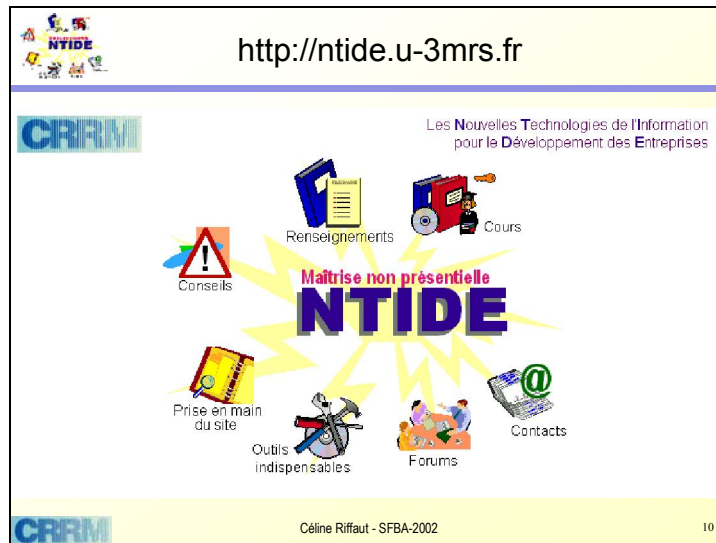
Figure 4 : les outils de la maîtrise

outils mis à la disposition des étudiants. Seule la partie associée à une clé est privative. Les autres parties peuvent être consultées librement.