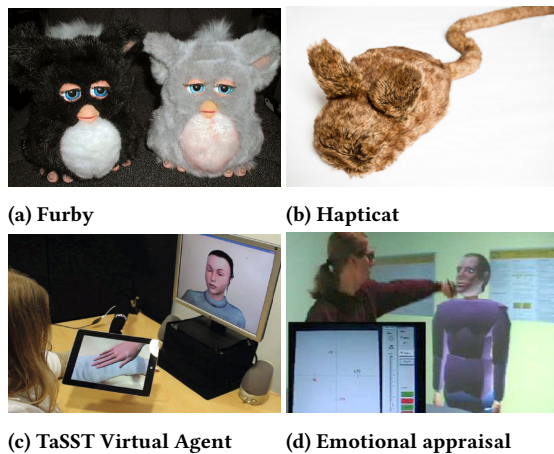
Figure 3: (a) Furby , un jouet robotique qui communique des émotions; (b) Hapticat , un jouet zoomorphique qui réagit en fonction des émotions des utilisateurs[107]; (c) TaSST , un dispositif de transmission de toucher social superposant la main d'un avatar en réalité augmentée; (d) Perception de toucher sur un agent virtuel.

étape. Inversement, selon certaines études, un toucher effectué par un robot pourrait être équivalent à un contact humain [105], la réaction sensorielle et émotionnelle de l'utilisateur étant similaire à celle qu'il aurait eu s'il avait été touché par un humain. Une étude a par exemple montré que le contact d'un robot vers un humain pouvait motiver la réalisation d'une tâche [88]. Cependant, les travaux en robotique se sont plutôt focalisés sur la transmission d'émotions positives pro-sociales [36], avec pour effet d'éviter les contacts physiques avec les humains pour des raisons d'acceptabilité sociale et de sécurité. Des travaux restent à faire pour donner aux robots la capacité de transmettre une plus grande variété d'émotions par le contact physique, et ce en toute sécurité.