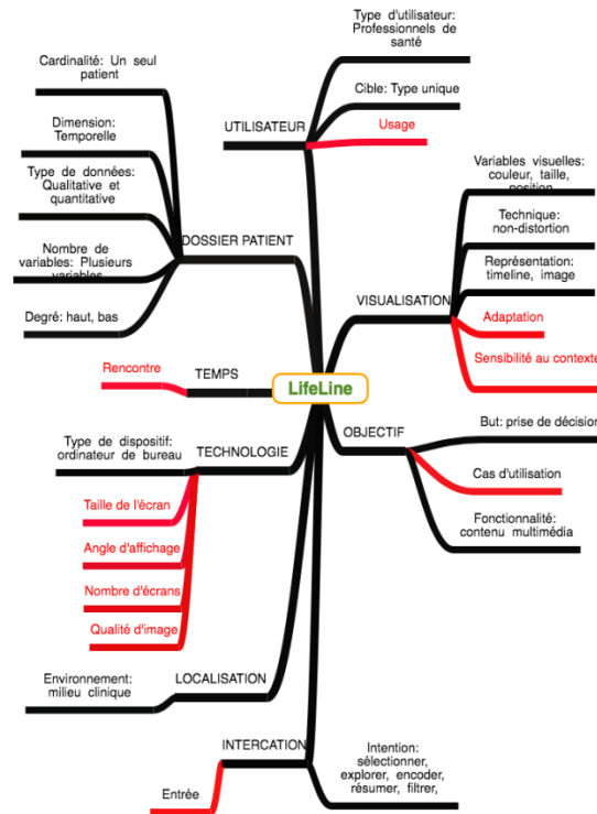
Figure 2: Illustration de la description du système Lifeline [20] plongé dans notre espace de conception

fenêtre qui s’affiche. La déformation ou la distorsion n’est pas explorée. Par exemple, sur un petit écran dans une situation de mobilité, si le concepteur utilise des fenêtres avec pagination, le médecin sera perdu avec la navigation dans le dossier patient qui contient énormément d’informations. À propos de l’adaptation et la sensibilité au contexte, aucun système cité ne prend en considération un paramètre contextuel pour présenter ou pour naviguer dans le dossier patient, pourtant l’adaptation peut être utile pour améliorer l’expérience utilisateur.