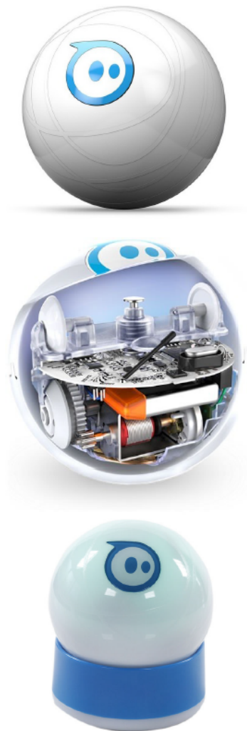
Figure 2. De haut en bas : la Sphero™, son intérieur et le socle de chargement

La Sphero™ peut aussi être utilisée comme un contrôleur. En effet, en annoncée entre 15 et 30 mètres selon la version de la balle. Concernant l'alimentation, elle embarque une batterie qui peut être chargée par induction à l'aide d'un socle dédié. Celui-ci pèse 72g. On peut s'attendre à une autonomie d'une heure pour 3h de charge. La Figure 1 présente la Sphero™, son intérieur et le socle. désactivant la stabilisation de la partie interne et mobile de la Sphero™, nous pouvons récupérer les données des capteurs et les envoyer par Bluetooth à un ordinateur ou terminal mobile qui a été appareillé au préalable. Ainsi, en manipulant la Sphero™ sur son socle, il est possible de tourner la balle selon les trois axes de rotation sans la soulever. Cette possibilité peut permettre de manipuler un objet 3D en utilisant la balle comme un tangible. Nous tirons profit de cette possibilité pour évaluer la faisabilité de réaliser les opérations TRZ d'un objet 3D.