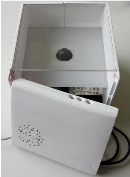
Figure 1: Prototype de l'ORBox

A l'intérieur du boîtier est déposée une Raspberry Pi qui contrôle le boîtier. Celle-ci est surmontée d'une caméra orientée vers le haut qui permet de voir le dessous des objets posés sur le plexiglas transparent. La caméra utilisée est équipée d'un objectif fish-eye de 170° d'angle de vue afin de voir toute la surface vitrée. Du fait de l'opacité des faces latérales, l'intérieur est sombre et les photos prises par la caméra ne sont pas exploitables dans un objectif de reconnaissance d'objets. Afin de pallier à ce problème, un ensemble de diodes électroluminescentes (DEL) a été installé afin d'illuminer le boîtier. Néanmoins, ce rajout de DEL a un effet secondaire sur les images prises par la caméra : en effet, elles réfléchissent sur le plexiglas transparent et apportent du bruit visuel dans l'image. C'est pourquoi, nous avons rajouté une plaque diffusante permettant d'obtenir un éclairage constant et homogène lors de la prise des images. Ce boîtier ayant pour vocation d'être utilisé par des personnes ayant une déficience visuelle, il embarque un haut-parleur afin que l'ORBox communique le résultat de la reconnaissance à l'utilisateur.