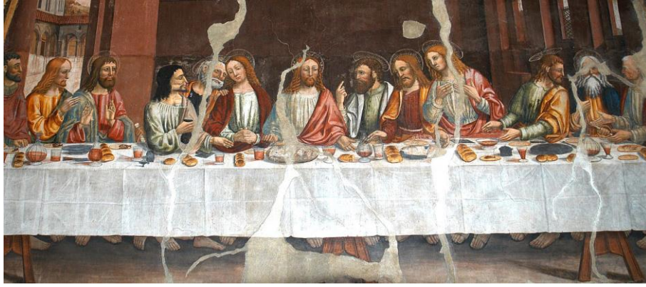
Figura 1: L'Ultima Cena della Cappella Marchionale di Revello (l'immagine è adattata da una cortesemente fornita del sito del Comune di Revello [5], utilizzata in questo articolo a scopo di studio e di ricerca, come permesso dalle note legali consultate il 27 Agosto 2017)