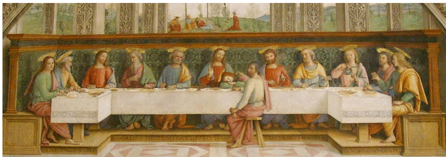
Figura 3: Ultima Cena di Pietro Perugino (1493-1496), affresco nel Cenacolo di Fuligno, Firenze.

Come già detto, ora è il tavolo con la tovaglia bianca ad essere in primo piano. Aggiungiamo a quanto detto in [6], che Giuda è, nel dipinto di Leonardo, posto insieme agli altri discepoli anche se leggermente in posizione avanzata. Quasi lo stesso capita nell'affresco di Revello. Leonardo ha posto quindi sullo stesso piano tutti i discepoli, ed il piano è quello della mensa del Signore. Il Perugino invece aveva posto Giuda separato, unica persona dal lato opposto della tavola. La posizione di Giuda è un segno veramente forte e distintivo nell'opera di Leonardo. Inoltre non ci sono aureole, che invece vediamo nel Perugino (unico personaggio che non l'ha è Giuda). Nell'affresco di Revello, l'artista ha seguito Leonardo ma ha lasciato le aureole a distinguere la santità. Giuda è senza aureola. Una curiosità, nell'Ultima Cena di Giusto de Menabuoi (Firenze, 1330 circa – Padova, 1390 circa) la disposizione dei discepoli è simile a quella del Perugino, ma Giuda ha un'aureola nera.