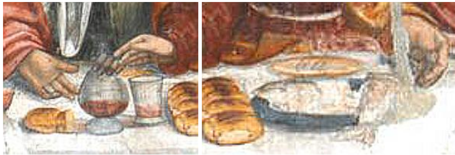
Figura 7: Dettagli dell'affresco di Revello.

Per continuare la discussione sull'affresco di Revello, facciamo sempre riferimento all'immagine al sito [5]; nell'affresco una delle mani di Tommaso è in una posizione innaturale (è una mano scura che sporge verso il bicchiere, Figura 7). Forse non è una mano di Tommaso. Sempre dall'immagine in [5], possiamo vedere che nel piatto di fronte a Giacomo Maggiore sembra esserci del pesce (Figura 7).