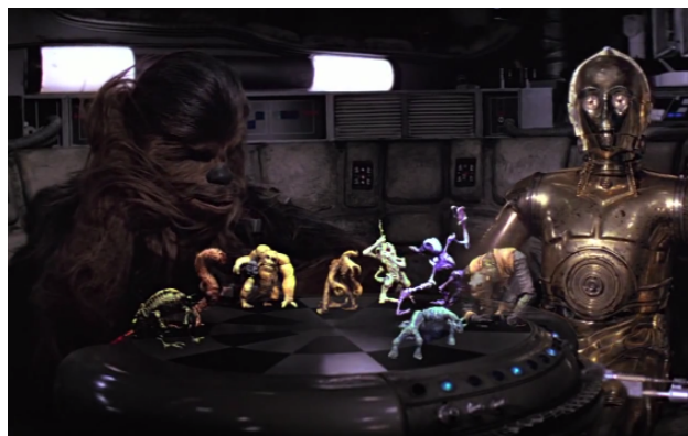
FIGURE 1: Le “Dejarik” dans son contexte d’origine (Starwars - Episode IV)

que les industriels se sont largement approprié. L’engouement actuel pour ces domaines s’explique en partie grâce aux avancées techniques et technologiques de ces 5 dernières années. En effet, les capacités de calculs et de rendus visuels des nouveaux dispositifs de RV/RA (ex. Visiocasques [1]) offrent maintenant de réelles opportunités d’immersions ou d’interactions aux utilisateurs de ces technologies. Tandis que les principaux moyens d’interactions associés aux visiocasques sont de type “manettes”, “pointeurs” ou “joysticks”, des recherches récentes visent à exploiter les avantages des interfaces tangibles (lire [4] pour la définition d’une interface tangible) comme élément d’interaction avec les dispositifs de RV, de RA voire de RM [3]. Nous proposons dans cet article de présenter un prototype de jeu distribué mêlant Table Interactive avec objets Tangibles (TIT) et visiocasque de RA en nous basant sur l’univers de Starwars. Notre idée principale : recréer le jeu “Dejarik” du film “Starwars, Episode IV” où l’on peut voir Chewbacca et R2-D2 jouer à un jeu holographique (cf. Figure 1). Ce cas d’usage amusant n’est qu’un prétexte visant à soulever et aborder les problématiques d’interaction homme-machine actuelles directement liées à l’usage de la RV et plus particulièrement des visiocasques. D’une manière plus concrète, “comment interagir le plus naturellement possible avec ces nouveaux dispositifs ?”.