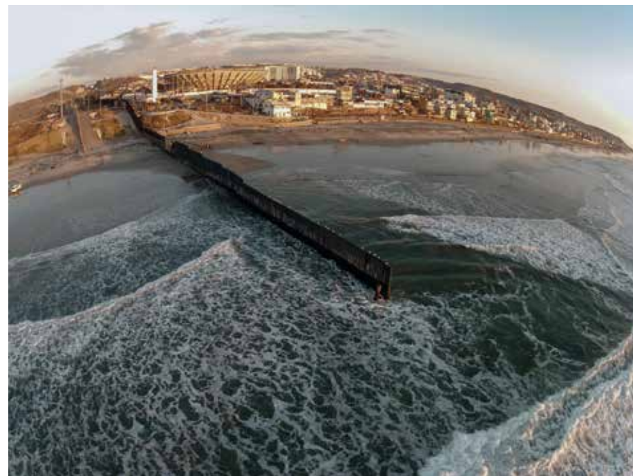
Adrian Missika, As The Coyote Flies , 2014, 14'35", vidéo HD, photogrammes, courtesy Galerie Bugada & Cargnel, Paris © Adrien Missika, 2016.