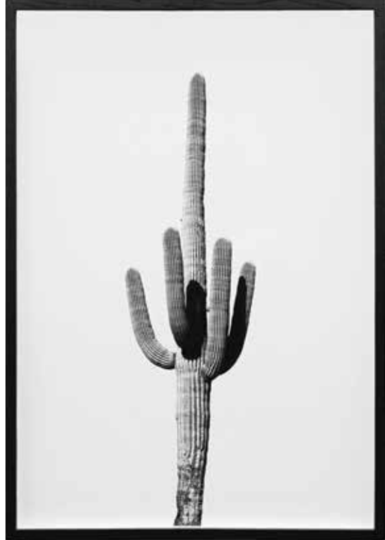
Adrien Missika, We Didn't Cross the Border, The Border Crossed Us , 2014, photographies noir et blanc, impression laser, 48 x 34 cm, courtesy Galerie Bugada & Cargnel, Paris, photo Julia Denat © Adrien Missika, 2016.