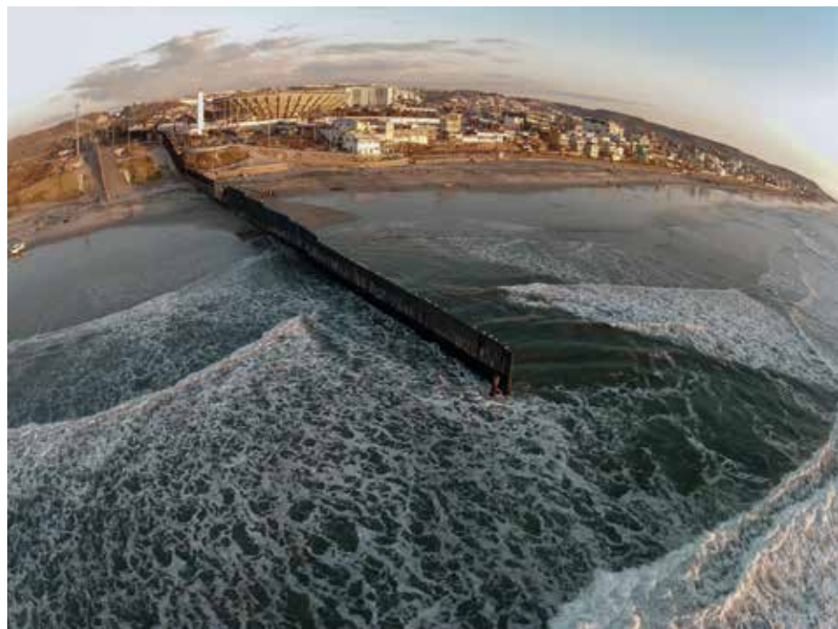
Adrian Missika, As The Coyote Flies , 2014, 14'35", vidéo HD, photogrammes, courtesy Galerie Bugada & Cargnel, Paris © Adrien Missika, 2016.