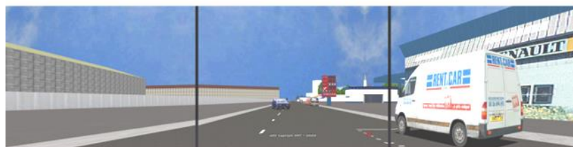
Figure 2. Simulation d'une situation d'accident

Visuellement, nous obtenons l'image ci-dessous (figure 2) pour le conducteur du simulateur ; cette image correspond au passage de la phase d'approche (situation de conduite) à celle de la situation d'accident.