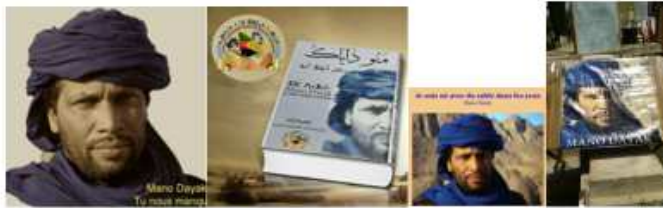
Déclinaison de l'image sur différents supports

par l'évocation de ses études à l'étranger, mais aussi ses démarches encourageant l'éducation.