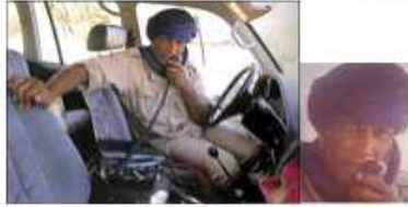
Déclinaison de l'image par recadrage