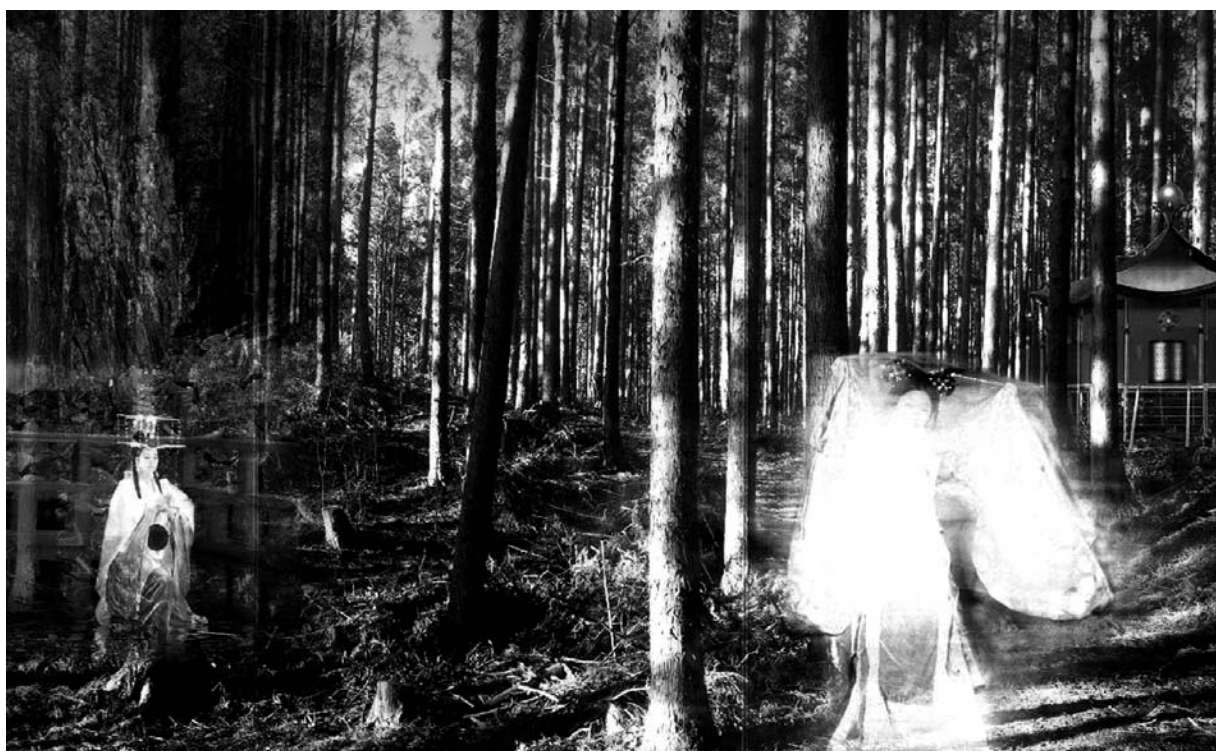
Kumano © Mariko Mori - Koyanagi, Tokyo