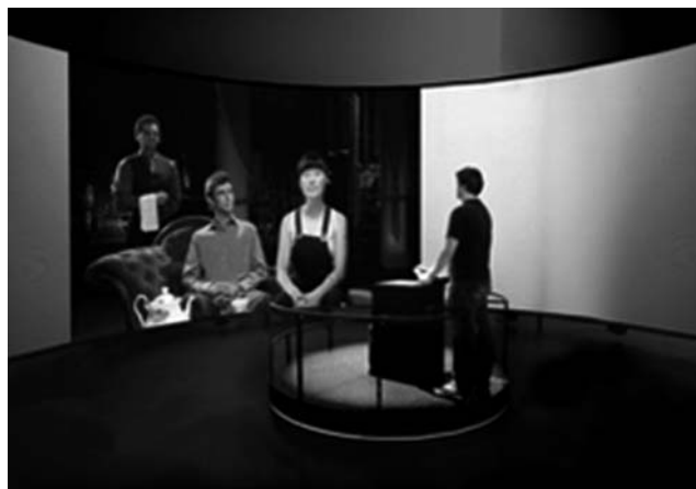
Eavesdrop © David Pledger et Jeffrey Shaw - Streen, Australie

art contemporain, image interactive mouvement, ces trois caractéristiques "nouvelles images" du jeu vidéo, de fiction. L'image-mouvement doit être