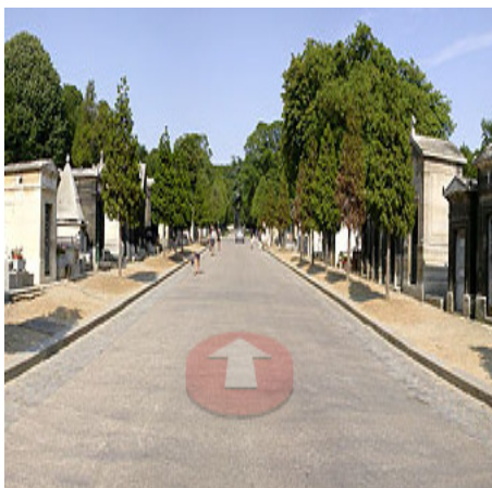
Figure 2: Capture du point de départ de la visite guidée virtuelle à l'entrée principale du cimetière du Père-Lachaise à Paris ( http //: www. Perelachaise.com ).

Les cartes au format A4 et présentant le moins de distracteurs visuels possibles, indiquaient les points de départ, d'arrivée et point intermédiaire par un cercle blanc numéroté (voir figure 3). Les trajectoires à suivre n'étaient pas autrement mises en évidence.