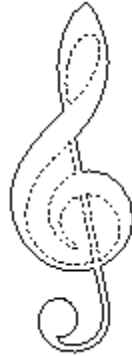
Fig 3 : Les parcours en pointillés sont coloriés en couleur de fond

Ensuite, tous les polygones de profondeurs paires sont remplis en noir, et tous les polygones de profondeurs impaires en couleur de fond. Enfin il faut dessiner les polygones dans l'ordre de profondeur croissante. Cet algorithme donne les mêmes résultats que l'algorithme pair-impair de PostScript Pour des parcours convexes complètement disjoints [3].