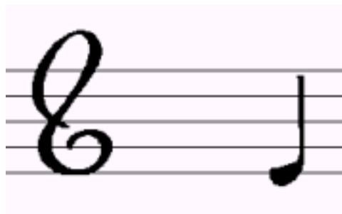
Fig 1 : Les marches d'escaliers

Pour cela, il faut redessiner le caractère à la bonne échelle, donc avoir une description de chaque caractère en terme de courbes et non en terme de points (selon l'opposition classique Vectorielle/bitmap) [2].