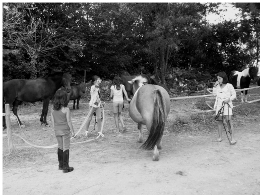
Fig. 1 – Les adolescent(e)s et les enfants constituent le public prédominant du marché de l'équitation en France.

sociales se sont amenuisées grâce à une politique de prix plus modérés (poney-club), tandis que les contraintes physiques dues à l'âge ou au handicap ont été diminuées grâce à la mise en place de produits adaptés, intégrant le dressage, et même la création de races de chevaux (telles que le henson), privilégiant la docilité et la maniabilité aux performances.