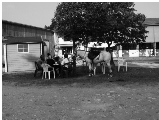
Fig. 2 – Utilisation du cheval comme un vecteur de socialisation.

par les adolescentes, comme un vecteur de socialisation et de valorisation. Sur la Figure 2, le poney, associé au temps des rafraîchissements, permet à sa cavalière d'attester de son statut de « propriétaire », par rapport aux autres, montant des chevaux de club et ne pouvant donc les garder après le travail.