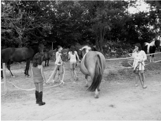
Fig. 1 – Les adolescent(e)s et les enfants constituent le public prédominant du marché de l'équitation en France (photo de Sylvine Pickel-Chevalier, 2013).

sociales se sont amenuisées grâce à une politique de prix plus modérés (poney-club), tandis que les contraintes physiques dues à l'âge ou au handicap ont été diminuées grâce à la mise en place de produits adaptés, intégrant le dressage, et même la création de races de chevaux (telles que le henson), privilégiant la docilité et la maniabilité aux performances.