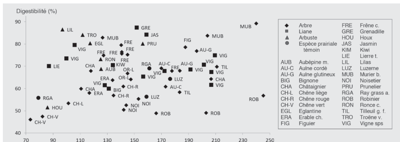
FIGURE 1 : Relation entre la teneur en MAT et la digestibilité enzymatique de feuilles de ligneux prélevées en été à Lusignan (2014 et 2015).

La relation entre la valeur azotée (MAT) et la valeur énergétique (digestibilité enzymatique) pour les échantillons récoltés en 2014 et 2015 (soit 59 échantillons) permet d'illustrer la diversité des ressources fourragères estivales collectées (figure 1), au moins pour ces 2 critères primordiaux pour le rationnement des animaux. Les caractéristiques relatives des